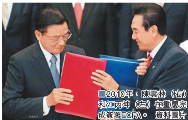
2010年，陳雲林(右)和江丙坤(左)在重慶完成簽署ECFA。

20年來兩會協商和兩岸關係走過的道路告訴我們，堅持「九二共識」，兩岸雙方的互信就能維持，基礎就能穩固，商談就能持續，兩岸同胞的福祉就能不斷增進。否定或者拋棄「九二共識」，不僅兩會協商會陷入停頓，兩岸關係也會發生倒退，兩岸同胞尤其是台灣同胞的利益就會受到損害。