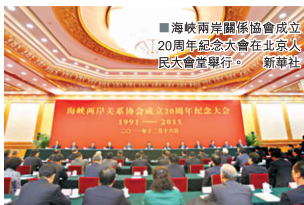
海峽兩岸關係協會成立20周年紀念大會在北京人民大會堂舉行。