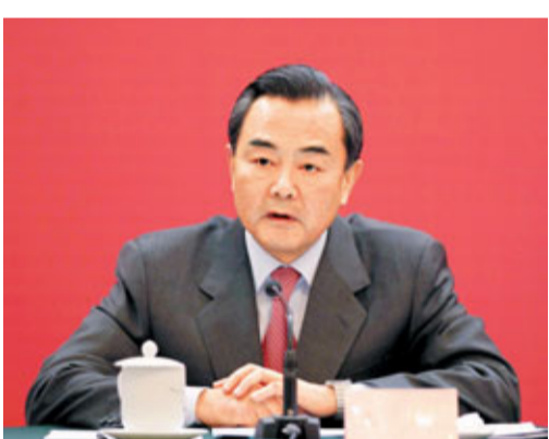
王毅出席紀念大會並講話。

王毅高度評價海協會充分發揮授權團體的獨特作用，為改善和發展兩岸關係作出了重要貢獻。他表示，中共中央台辦、國務院台辦將一如既往地支持海協會為兩岸商談發揮重要作用，加強與台灣各界人士交流往來，處理好兩岸同胞交往中的具體問題，維護好兩岸同胞的合法權益。王毅強調，在兩岸之間固有矛盾一時難以解決的歷史條件下，「九二共識」的達成，體現了兩岸雙方擱置爭議、求同存異的政治智慧。