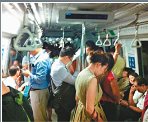
■故障列車停電，部分車廂一片昏暗。網上圖片