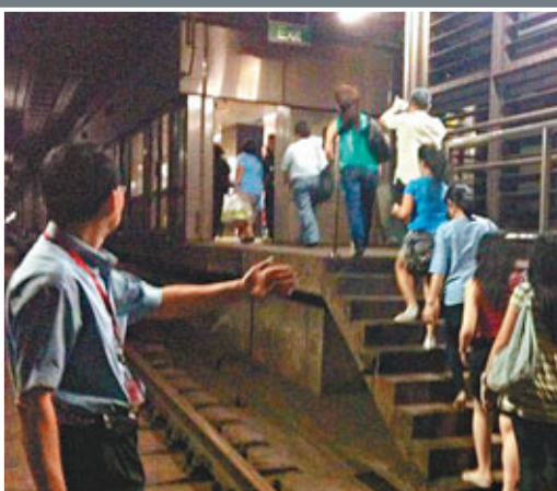
■乘客在隧道內摸黑徒步離開。網上圖片