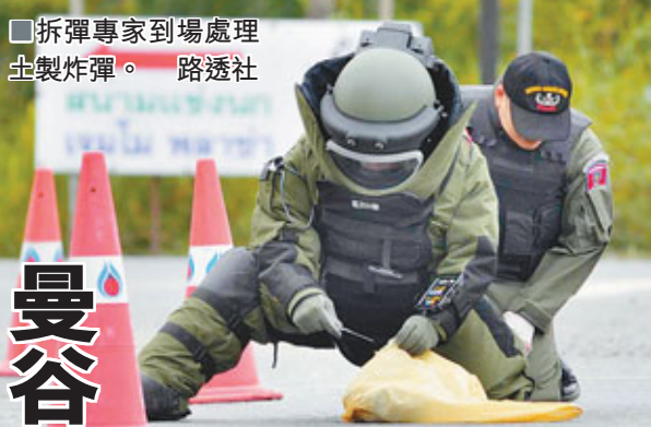
■拆彈專家到場處理土製炸彈。