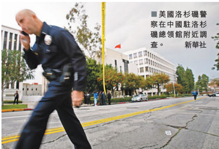
美國洛杉磯警察在中國駐洛杉磯總領館附近調查。

北京外交部發言人劉為民16日表示，中國高度重視事件，中國駐美國大使館駐洛杉磯總領事館已向美國國務院提出交涉，北京敦促美國盡快破案並採取切實有效措施，保障中國駐美機構和人員的安全保衛。