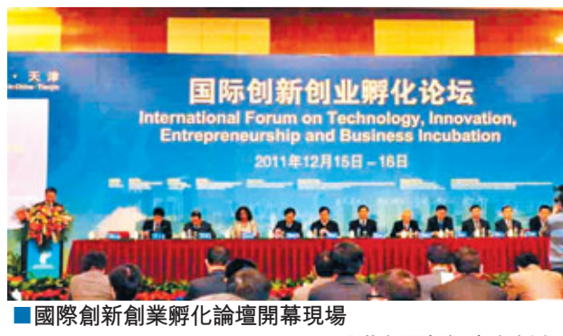
國際創新創業孵化論壇開幕現場

據悉，本次論壇包括國際孵化器發展高峰論壇、海外留學人員歸國創新創業論壇、中國科技創業高峰論壇等3個專題論壇，是全國創業與孵化領域最具權威、最高規格、最大規模的專業盛會。