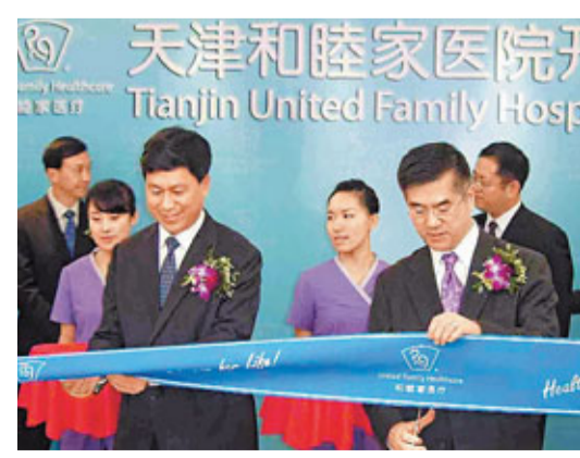
駱家輝(右)與荷利軍共同為天津和睦家醫院開業剪綵。香港文匯報記者 趙大明攝

駱家輝在開業致辭中說，這是中美在衛生醫療領域開展合作交流的果實，希望將來看到更多的合作。出席開業儀式的天津市委常委荷利軍說，天津和睦家醫院為天津市民帶來了高品質的醫療服務，為天津各界人士就醫提供了多種選擇。