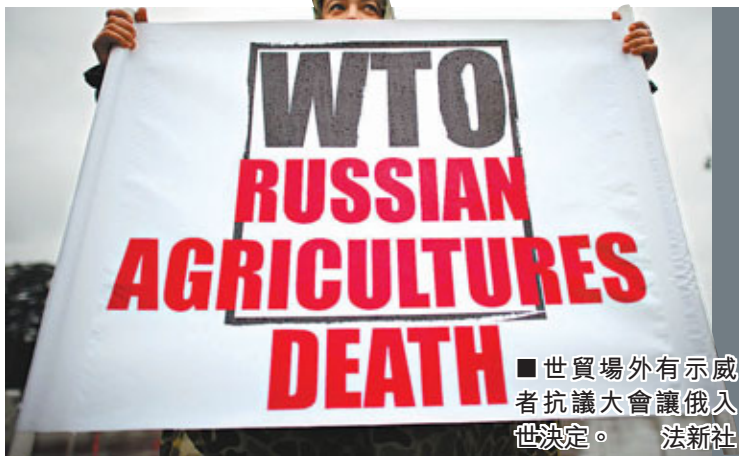
■世貿場外有示威者抗議大會讓俄入世決定。