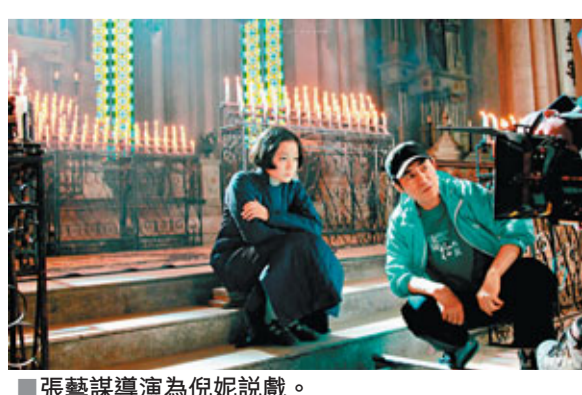
張藝謀導演為倪妮說戲。