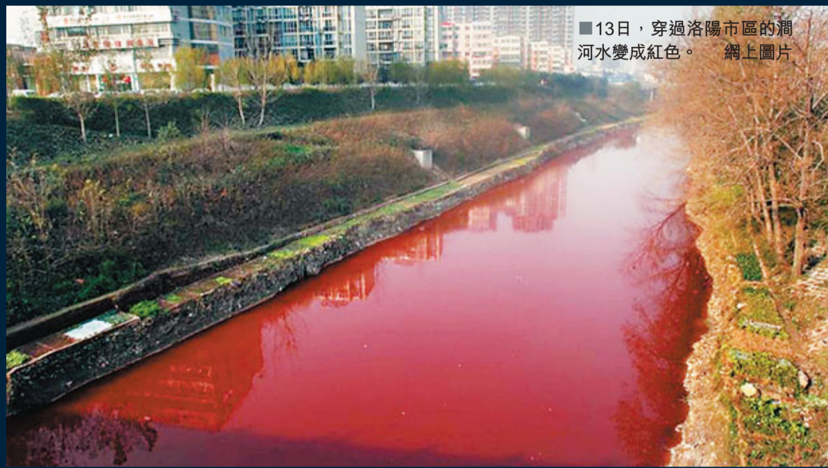
■13日，穿過洛陽市區的澗河水變成紅色。