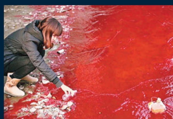
■檢測人員取河水化驗。