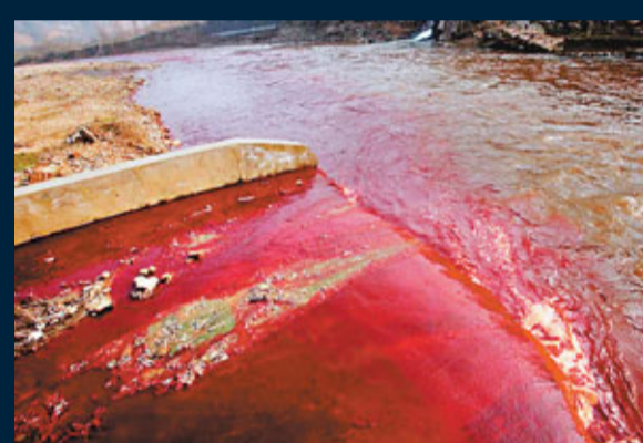
■污水就是從這裡入河。

香港文匯報訊（記者 戚紅麗、實習記者 王露）河南洛陽市出現「血流成河」情景。洛陽華山路澗河橋段因受未經處理的工業污水污染，自本周二起，河水彷彿被血染了一樣。紅色污水沿着幾十級台階飛流而下，之後經過一段約150米左右的通道，最終注入澗河。當地環保部門已找到排放「紅水」的源頭，並查出兩個非法作坊。雖然河水已經恢復原樣，但澗河兩岸的污染現象仍較嚴重，環保形勢不容樂觀。