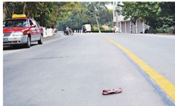
■一隻女生的鞋子還留在事發現場附近。