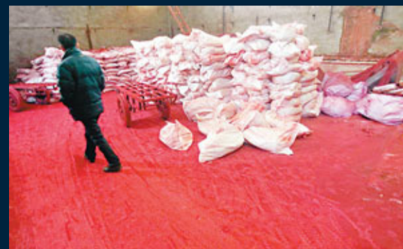
■14日，河南洛陽，執法人員在查處紅色染料源頭的非法作坊。