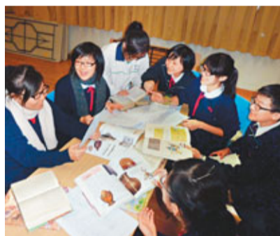
■保良局董玉娣中學認真備戰「國情知識大賽」複賽,但亦強調享受過程,不強求勝利。

董玉娣中學問答隊的常備操練,除搜集資料和互相討論外,亦特別設有「二四飯局」,隊員每逢星期二、