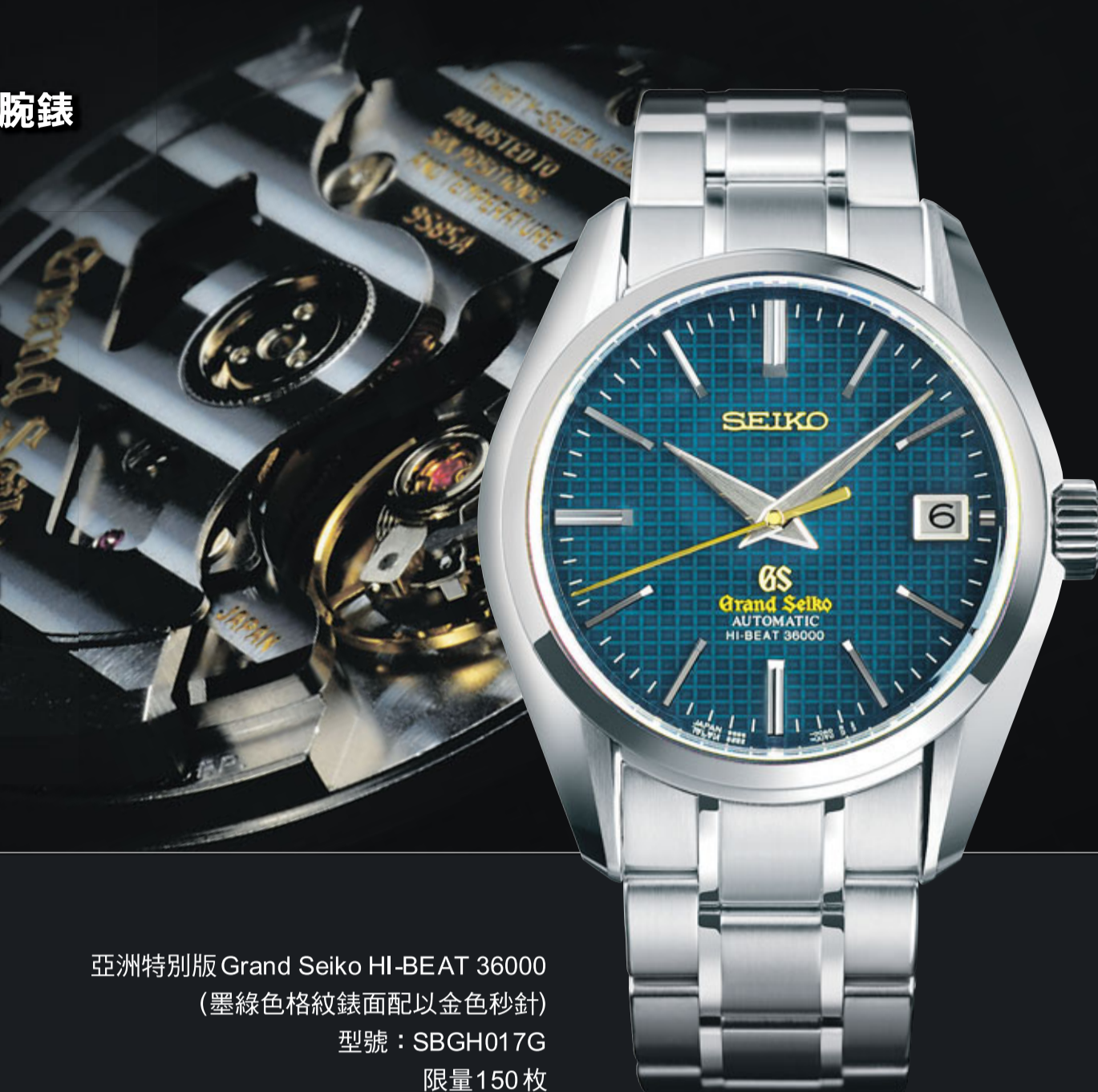
亞洲特別版 Grand Seiko HI-BEAT 36000 (墨綠色格紋錶面配以金色秒針) 型號：SBGH017G 限量 150 枚

全新 Grand Seiko 亞洲特別版搭載了「HI-BEAT 36000」高擺頻機械機芯，再次帶領機械錶到達一個更優秀的新領域。自動及手動上鍊機械機芯，每小時振動 36,000 次，每日誤差 -3 秒~+5 秒，達到世上最嚴謹的 Grand Seiko 檢測標準。錶面的墨綠色格紋和金色秒針，加上以無反射藍寶石水晶玻璃、精鋼錶殼及錶帶製作，實在是高精準度和高品質的完美結合。