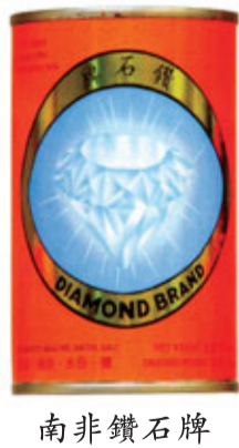
南非鑽石牌 超級瀟心罐鮑