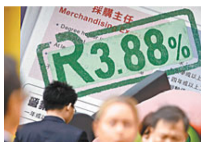
消委會發現一般客戶稅貸實際利率較去年高0.5至1個百分點。

香港文匯報訊(記者 陳寶瑤)雖然經濟不明朗,但今年銀行稅務貸款息率仍較去年稍為上升,市民借錢交稅的成本較去年昂貴。消委會本月初搜集20間銀行和財務公司的稅務貸款計劃,發現一般客戶的稅貸實際利率介乎2.31%至10.81%,較去年高0.5至1個百分點。消委會提醒市民,應比較不同金融機構提供的「實際利率」,能更實質反映借貸成本。