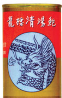
南澳洲龍標牌 特級罐鮑

歷史悠久 遠近馳名 保證名廠出品 精選活鮑魚 清湯研製 味美鮮滑 罐罐原湯原味 烹調容易 省時快捷 滋補養顏