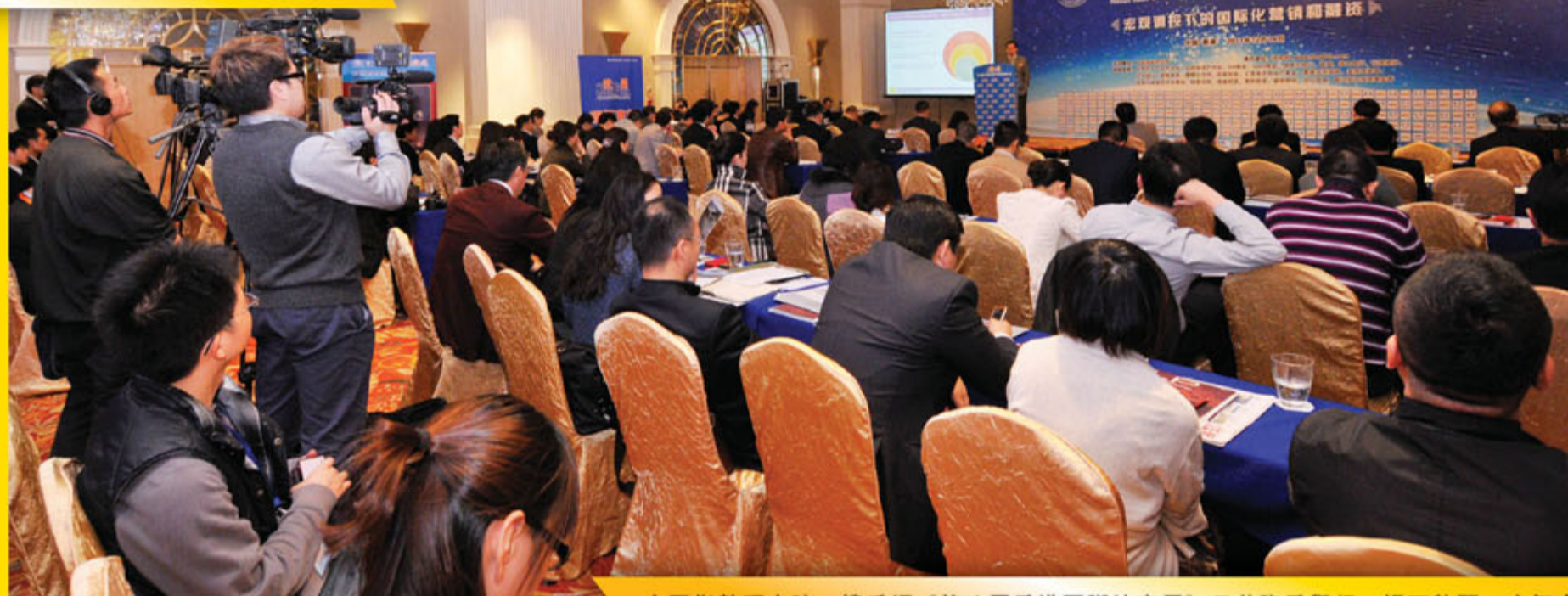
中國指數研究院·搜房網《第八屆香港國際地產周》日前隆重舉行，場面熱鬧，座無虛席。

第八屆香港國際地產周於日前(十二月十四日)圓滿舉行。當日，國內外知名經濟學家、政府官員、投資基金、地產界等聚首一堂，包括：中國人民大學、瑞士銀行投資銀行、花旗環球投資銀行、搜房控股等，把脈宏觀調控下的國際化營銷和融資。主辦單位更誠邀美聯集團副主席、中國對外貿易理事會永久常務副理事長黃錦康成為演講嘉賓，為大家深入剖析世界各國不同地區發展周期對中國地產發展周期之啟示，其精彩演說更博得全場如雷掌聲。