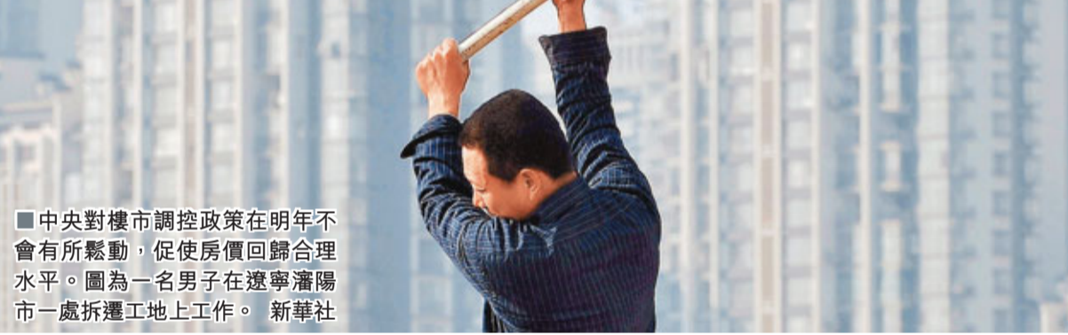
中央對樓市調控政策在明年不會有所鬆動，促使房價回歸合理水平。圖為一名男子在遼寧瀋陽市一處拆遷工地上工作。