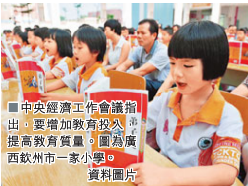
中央經濟工作會議指出，要增加教育投入，提高教育質量。圖為廣西欽州市一家小學。

此外，會議還要求，必須統籌處理速度、結構、物價三者關係，財政政策要繼續完善結構性減稅政策，加大民生領域投入，積極促進經濟結構調整，嚴格財政收支管理，加強地方政府債務管理。加強預算管理，嚴格控制「三公」等一般性財政支出。調整財政轉移支付結構，加強縣級基本財力保障。推進營業稅改徵增值稅和房產稅改革試點，合理調整消費稅範圍和稅率結構，全面改革資源稅制度，研究推進環境保護稅改革。