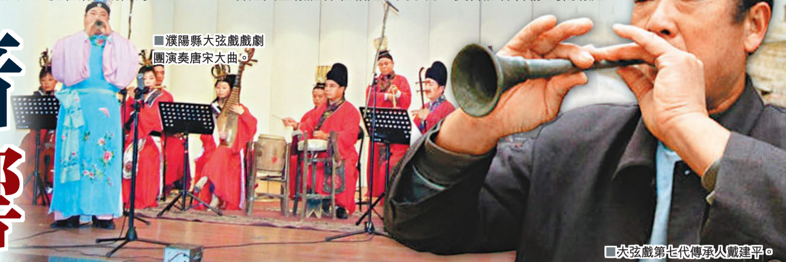
■濮陽縣大弦戲劇團演奏唐宋大曲。