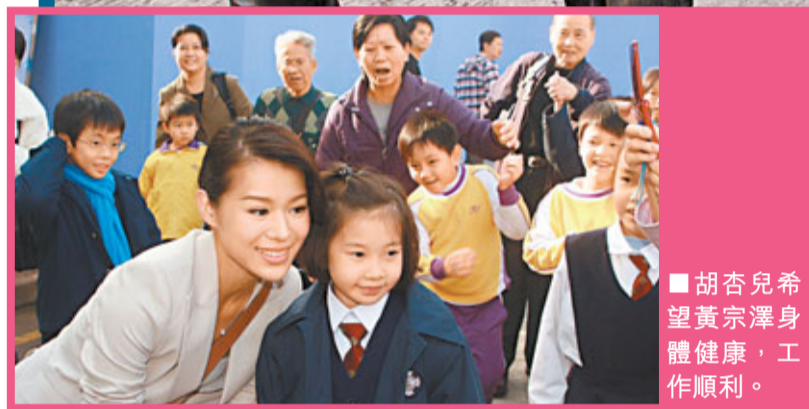
胡杏兒希望黃宗澤身體健康，工作順利。