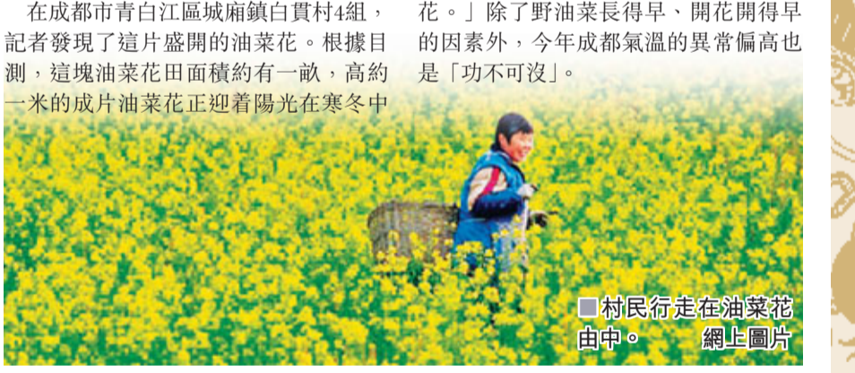
村民行走在油菜花田中。

香港文匯報訊（記者 唐鑾宇 成都報導）「寒冬臘月，鄉間的油菜花開正艷，你相信嗎？反正我是信了。」10日，新浪微網友「白桂斌V」在其微博上貼出了幾張油菜花盛開的圖片，引來了眾人的「圍觀」。原本應在春天盛開的油菜花真會在臘月怒放？記者為此專程進行了實地探訪。