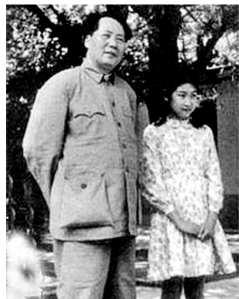
毛澤東與李訥。