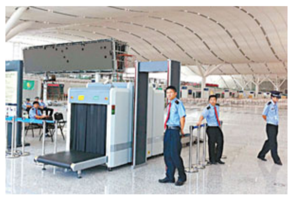
■廣深高鐵路16日起將試運,深圳北車站房安保嚴格,開通前三天將封站。

記者昨日前往深圳北站,廣場前的一塊巨型液晶顯示屏上,已顯示有中英雙語的列車進出時間表。透過玻璃能看見高鐵路候車大廳內有大量鐵路工作人員和日常保潔人員在各處奔忙,大廳廣播也開始播出列車進出和接送旅客注意事項的語音。根據顯示的列車運行圖,發車密度最緊湊的11時和13時,每隔15分鐘即有列車發出。晚高峰由深圳開往廣州方向的多趟列車則都以25分鐘的間隔發出,其餘非繁忙時間,部分動車的發車間隔則達1個小時。