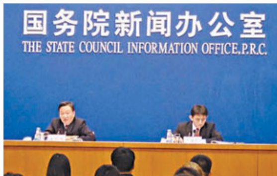
■商務部副部長姜增偉(左)介紹,中國將建立打擊侵權長效機制。

香港文匯報訊(記者 何凡 北京報導)商務部副部長姜增偉13日在國新辦發佈會指出,國務院成立全國打擊侵犯知識產權和製售假冒劣劣商品工作領導小組,建立起常態化工作機制。姜增偉又表示,目前考慮從研究刑法修改等方面修訂相關法律法規,加大懲處力度,並將打擊侵權和假冒劣劣工作納入各級政府的績效考核體制。