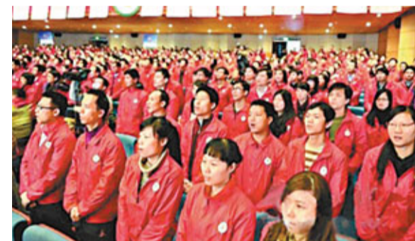
■12日,「圓夢計劃」2011年廣東萬名新時代產業工人入學典禮在中山大學舉行。資料圖片

在開學典禮上,廣東省委副書記、省社工委主任朱明國表示,廣東將加大教育等公共服務惠及產業工人的力度,積極推進產業工人共建共享美好生活。他還傳遞一個重要信息:「中共廣東省委已經考慮,在下一步省委、省政府的文件中,盡量不出現『農民工』這個詞彙,改稱『新時代產業工人』。」