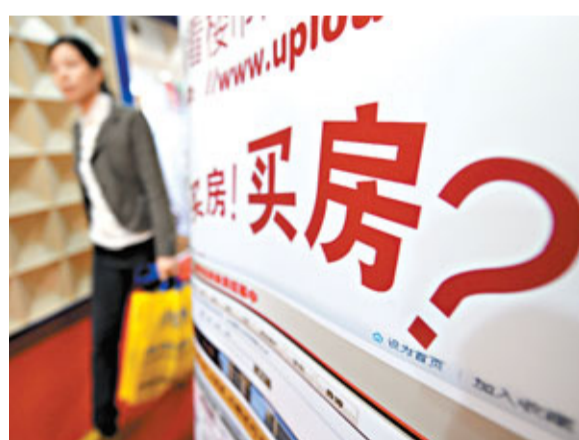
■內地房價若回落到09年水平,業界料買家將重返市場。資料圖片

不放鬆之下,2012年中國房地產市場將軟着陸,房價將跌10%,一線、二線及三線城市房價分別跌20%、15%及5%-10%,平均房價將回落到每平方米4,400元人民幣,近09年水平,屆時料買家將重返市場。