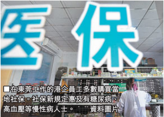
■在東莞工作的港企員工多數購買當地社保。社保新規定惠及有糖尿病、高血壓等慢性病人。 資料圖片