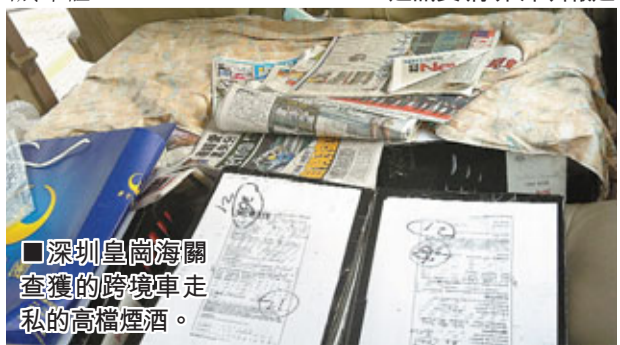
■深圳皇崗海關查獲的跨境走私的高檔煙酒。