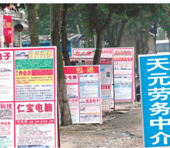
隨着「回鄉潮」顯現，昆山各大招工中介門庭開始冷落，用工成本激增讓昆山製造企業頭痛不已。

蘇州大學一位不願透露姓名教授認為，新興產業的發展並不會牽扯昆山官員多少精力，因為它是實驗室經濟，人才、資金、產業孵化、院校支撐內地都有一套模板，昆山經濟實力雄厚，在新興產業的招引上競爭對手寥寥。但一個不爭的事例是，政府希望一些台資企業轉型，做自己的品牌，但台資們習慣為品牌商做代加工。因為代工廠只需要跟着品牌企業轉，而品牌需要持續推進，這是一個燒錢過程，加之大陸對知識產權保護力度不足。一位手機核心接插件製造商說，「如果政府再來談轉型的事，我就先轉移了。」