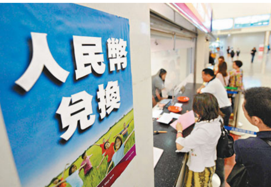
人民幣兌美元連續第九日觸及跌停。

另一方面，國際清算銀行的報告中也指出，離岸人民幣市場的發展可能衝擊內地債券市場，並加快企業從銀行融資中撤離，令內地的貨幣和信貸政策的調控更為複雜。