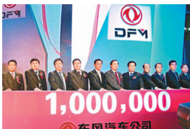
東風自主品牌年度百萬輛汽車下線。

香港文匯報訊 (記者 肖晶 湖北報道) 東風汽車股份(0489) 母公司東風汽車公司日前公布，根據名為「乾」D300的發展計劃，未來5年東風將投入300億元(人民幣，下同) 以上的資金發展自主事業，預計到2016年，東風自主品牌汽車銷量將達300萬輛。