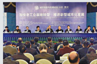
近百名專家學者出席城市轉型與發展論壇。

服裝、傳媒板塊也表現低迷；只保險、紡織機械板塊勉強收漲。分析人士指出，明年政策如此定調，究其原因，是明年經濟走勢尤其是外圍環境充滿不確定性，如果過早全面放鬆貨幣政策，將給經濟埋下通脹重啟、資產泡沫的隱患，不利於平穩運行。