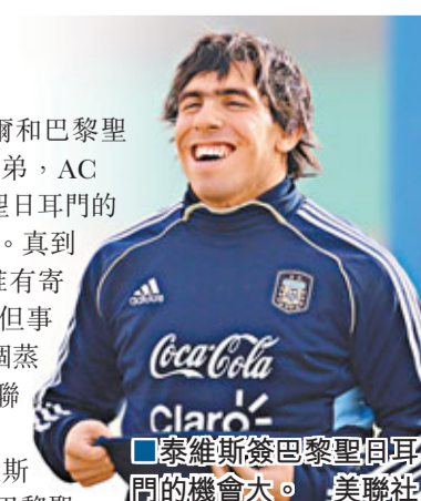
泰維斯簽約巴黎聖日耳門的機會大。

案，轉會費為2300萬歐元。有報章稱，巴黎聖日耳門要斥資3000萬歐元購買泰維斯。曼城一般會選擇出價高者。但如果泰維斯不願意去巴黎，這筆生意也難成交。