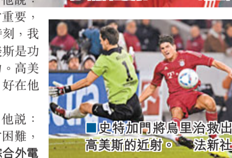
史特加門將烏里治救出高美斯的近射。