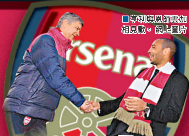
亨利與恩師雲加相見歡。