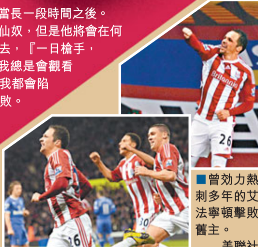
曾效力熱刺多年的艾法寧頓擊敗舊主。