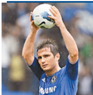
在車路士失意的林柏特會跟恩師到皇馬嗎？ 路透社

說到摩連奴和林柏特，他非常看重林柏特的經驗，此前，在執教國米(2008年)和皇馬(2010年)期間，摩連奴就先後兩次嘗試簽下林柏特，但林柏特都選擇了留下，不過，這一次車路士可能會同意放人。波亞斯正在有條不紊地改造着車路士的中場，《每日郵報》稱，車路士已接近以2000萬鎊的轉會費簽下紐卡素中場迪奧迪。科特迪瓦國腳的經理人上週五與車路士高層進行了密談，希望能夠達成協議。迪奧迪目前還在養傷，但車路士已訂上他多時。波亞斯希望在下個月成功購入迪奧迪，以便重建車路士的中場，而2000萬鎊的報價對去年夏天以350萬鎊轉會費購來迪奧迪的紐卡素老闆艾殊來說，簡直不可能拒絕。