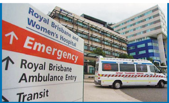
昆士蘭衛生部接連爆出醜聞，當局宣布改組架構。