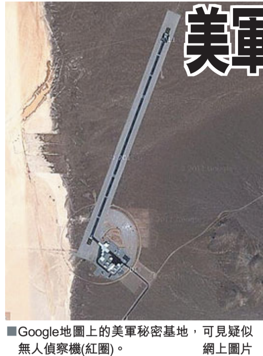
Google地圖上的美軍秘密基地，可見疑似無人偵察機(紅圈)。

Google地圖功能多元化，只需安坐家中便能「瞬間看地球」。近日有眼利的網民透過Google衛星影像，發現美國內華達州亞卡湖一個秘密軍事基地，疑用作測試類似早前被伊朗擊落的RQ-170無人偵察機，令外界再度關注美軍高度機密外洩，指責Google損害國家安全。