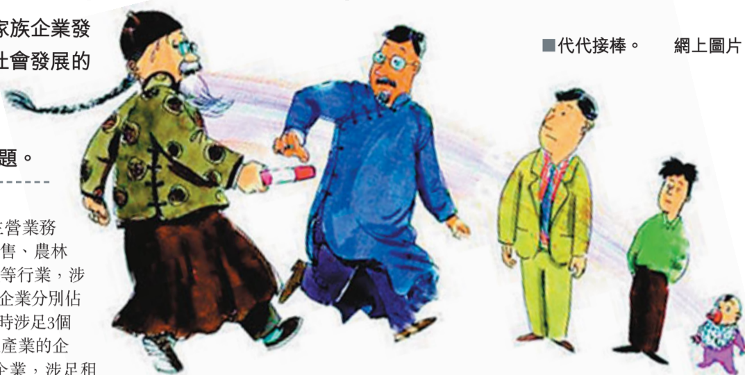
■代代接棒。

香港文匯報訊(記者 劉曉靜 北京報導) 首份《中國家族企業發展報告》昨日在北京發佈, 報告稱家族企業已成為經濟社會發展的重要力量。報告推算, 未來5至10年家族企業將迎來歷史上規模最大的一次家族傳承, 而由於企業主和傳承人之間交接班意願存在矛盾, 超75%的家族企業面臨交接班問題。