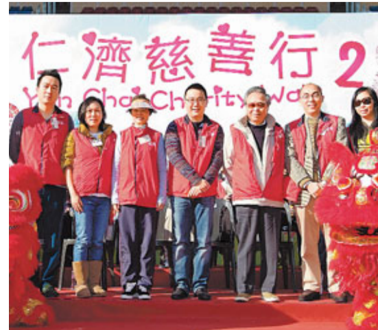
■嘉賓出席仁濟慈善行2011。

是次活動旨在為「仁濟社會服務基金」籌款。仁濟醫院自1978年開始提供社會福利服務, 於全港各區超過30多個服務單位提供安老、復康、青少年及幼兒服務。