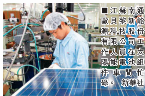
江蘇南通歐貝黎新能源科技股份有限公司工作人員在太陽能電池組件車間忙碌。新華社

此外，在海外的商業存在形式上，中國要着力培養自己的跨國公司。擁有本土經濟形式參與、創造當地就業的跨國公司易於打破貿易壁壘。