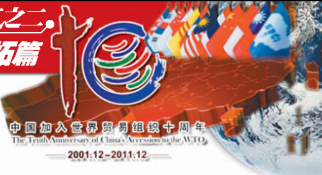
中國加入世界貿易組織十周年 The Tenth Anniversary of China's Accession to the WTO 2001.12-2011.12