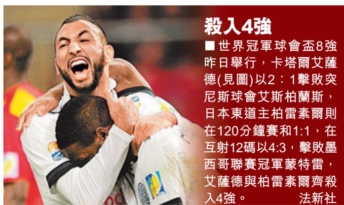
■香港文匯報記者 梁啟剛

另外，國際米蘭10日主場靠日本球星長友佑都及柏仙尼的入球，以2:0擊敗費倫天拿，積分排名艱難爬升至第9；拉素客場以3:2險勝萊切，高路斯獨中兩元。