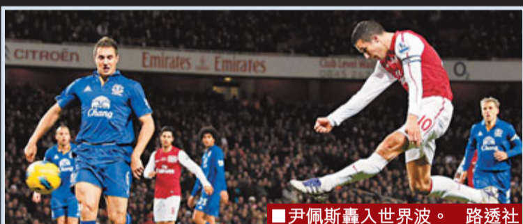
■尹佩斯轟入世界波。