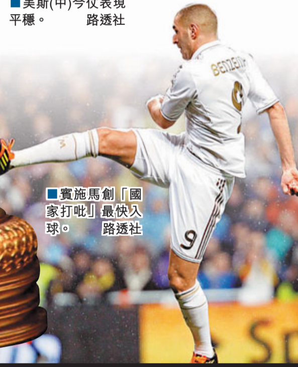
■實施馬創「國家打吡」最快入球。