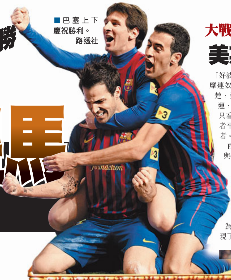
■巴塞上下慶祝勝利。