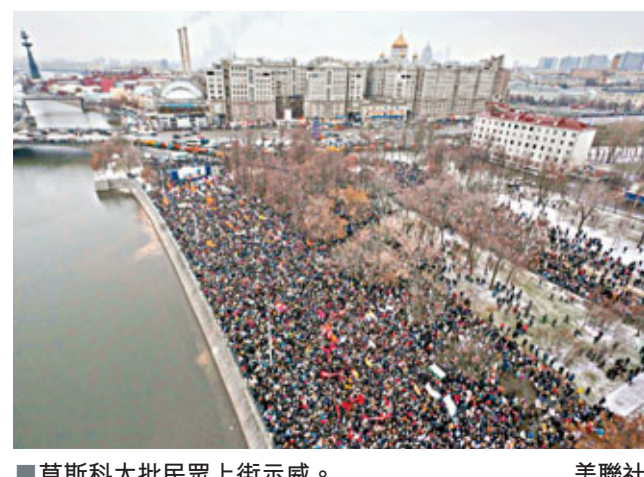
■莫斯科大批民眾上街示威。