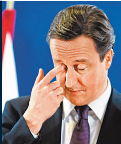
■卡梅倫在歐盟峰會上面露疲態。