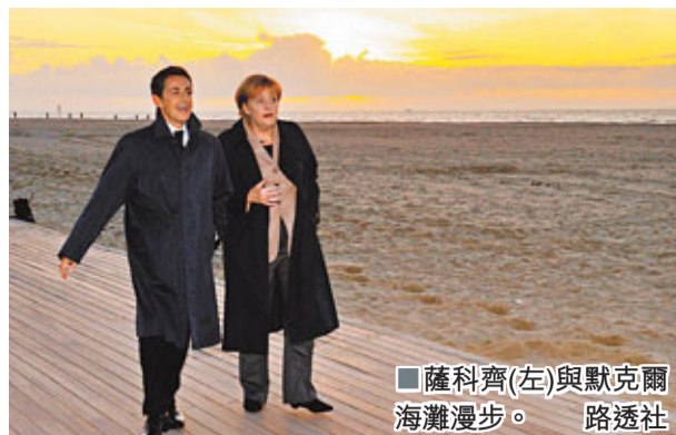
■薩科齊(左)與默克爾海灘漫步。

歐盟峰會落幕，德法兩國俱成大贏家，也間接證明德國總理默克爾和法國總統薩科齊經過多年磨合，合作日益熾火純青，這次更以互補締造雙贏。美聯社記者埃迪追訪兩人多年，認為「默科齊」的感情，確實與當初大有不同。