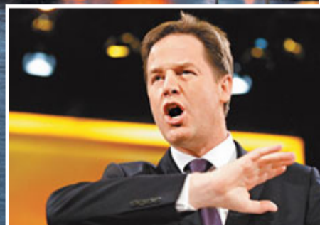
■副相克萊格批評卡梅倫的決定。