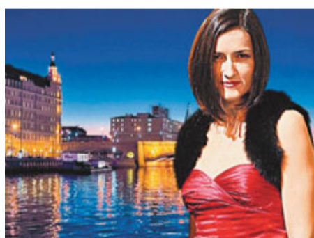
■西班牙文化部長岡薩雷斯(見圖)外訪時卻胡亂花費，包括搭乘飛機商務客位和住宿豪華酒店套房，浪費納稅人金錢。

西班牙失業率高達21%，國民被迫勒緊褲帶，學校更要下令少使用廁紙，但即將卸任的文化部長岡薩雷斯(見圖)外訪時卻胡亂花費，包括搭乘飛機商務客位和住宿豪華酒店套房，浪費納稅人金錢。