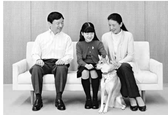
德仁太子與女兒愛子公主(中)和妻子雅子王妃(右)一家被皇室孤立。

日本《朝日新聞》上周報道，皇太子德仁一家正受整個皇室孤立，導火線是日皇明仁因支氣管炎入住東京大學醫院19天以來，雅子王妃並無前去探望，引起其他皇室成員不滿，分歧逐漸加深。由於德仁或被「打入冷宮」，令他的弟弟文仁親王繼承皇位的機會大增。