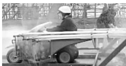
「糖果車」成功前行239呎。