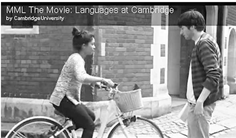
電影男主角與女主角在單車路上相遇的情景。

為了招生，很多院校都出奇謀，連名牌學府劍橋大學亦不例外。近日影片分享網站YouTube出現一套迷你電影，內容講述一名男大學生因沉醉法國詩集，不小心走出單車路上，與正在騎單車的漂亮女生相遇，他們一見鍾情，男生自此對心中女神念念不忘，二人最終在五月舞會再次偶遇，並在河畔漫步共度浪漫時刻。