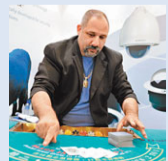
博彩專家Sal Piacente在亞洲博覽會博防千術研討會中，展示常見的出千伎倆。

早前在澳門舉行的亞洲國際博覽會曾特別邀請世界著名博彩專家Sal Piacente開設博防千術研討會。Piacente曾於70多家娛樂場從事博防千術工作，在防千術方面擁有25年的豐富經驗，堪稱為防千術的權威。