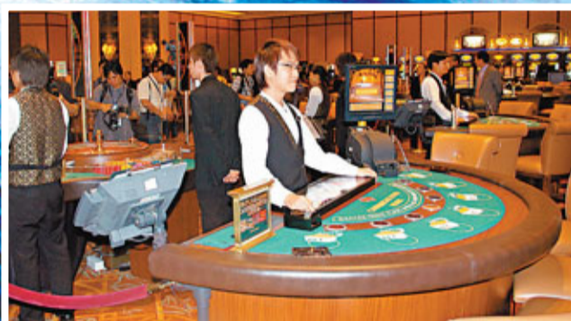
澳門賭場內明處和暗處，裝滿各式變焦攝錄鏡頭，監察博彩騙徒的舉動。