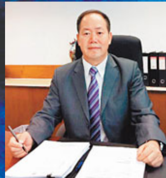
澳門司警調查廳廳長張健華接受本報訪問。