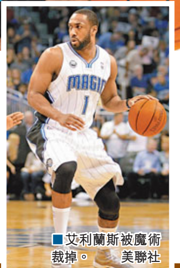
■艾利蘭斯被魔術裁掉。