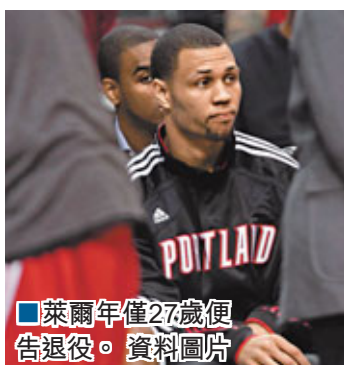
■萊爾年僅27歲便告退役。

另外，新達成的勞資協議重新規定「特赦條款」，魔術決定以此放棄身價逾億美元的麻煩後衛艾利蘭斯。根據新的特赦條款規定，每隊可對陣中最不想要的一名球員進行裁員，而被裁球員的薪酬，將不會像以往般計入球隊薪酬總額內。艾利蘭斯目前尚有一紙價值6230萬美元的3年合約，本季