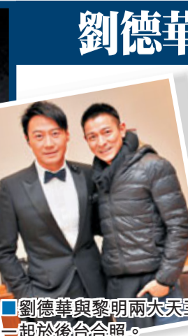
劉德華與黎明兩大天王一起於後台合照。