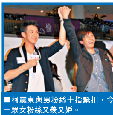
柯震東與男粉絲十指緊扣，令一女粉絲又羨又妒。

難道不擔心惹來同性的追求？他依然笑說：「沒所謂吧，我不介意，還很歡迎，他們都是需要鼓勵和支持的！」記者笑問他是否肯定是喜歡女生的？他帶笑說：「到目前為止也是！」他指出本身有很多男性朋友，大家閒來都有拿「告白」來玩，只是他從未試過向男生告白。但又怎樣跟女生告白？他坦言情信未有寫過，都是傳短訊，當然亦有成功過，他還會直接留言說希望對方跟他在一起。