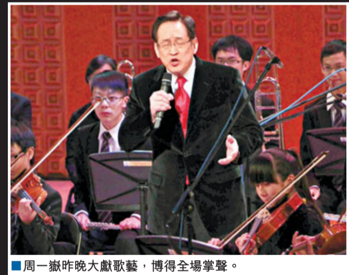
周一嶽昨晚大獻歌藝，博得全場掌聲。