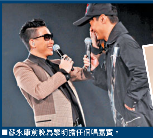
蘇永康昨晚為黎明擔任個唱嘉賓。