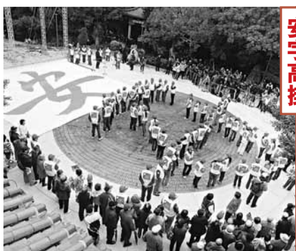
台灣加油 讀舉行「安字高掛」活動，號召支持者在廣場排出「安」字，祈求生活安定。中央社

馬英九說，楊玉欣為弱勢朋友請命後，聽到了低收入家庭兒童的生活補助有18年沒有調整，「真的滿心酸的」。所以政府做了一個很重要的決定，「花200多億元(新台幣)，真正能夠將弱勢中的弱勢提高到某種地位，不敢說好，但至少生活上過得去」。