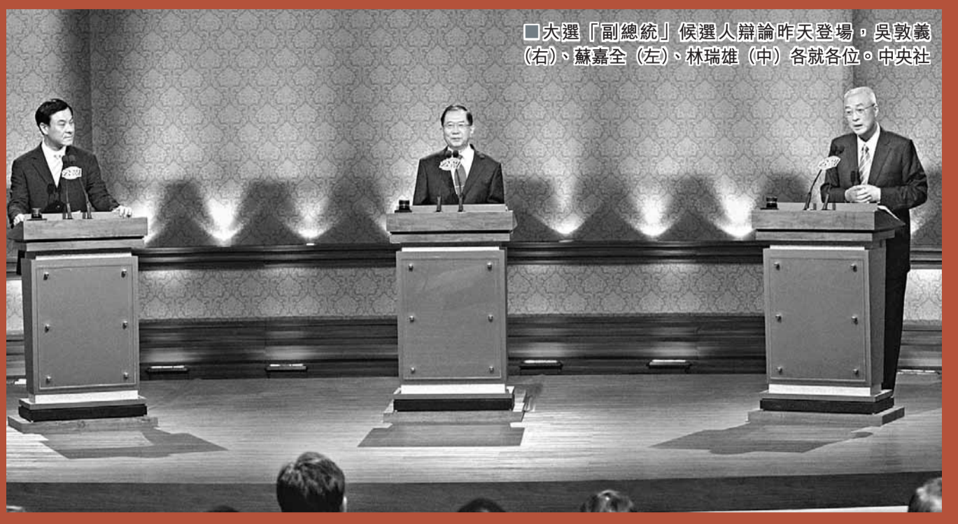
大選「副總統」候選人辯論昨天登場，吳敦義(右)、蘇嘉全(左)、林瑞雄(中)各就各位。

香港文匯報訊 綜合報導：台灣選舉史上首次「副總統」候選人辯論10日舉行，外界預計三人混戰的精彩場面未曾出現，卻變成藍、綠針鋒相對的局面。國民黨「副總統」參選人吳敦義在辯論會上批評，貪腐的扁政府對台灣造成的傷害至今未過，而縱觀今年民進黨競選的團隊中，「扁朝勢力」仍為靈魂，難以令人相信「英嘉配」會是一個好的選擇。