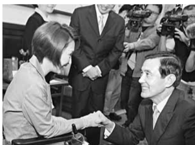
馬英九(右)與楊玉欣(左)對談。中央社

香港文匯報訊 據中央社報導，現任台灣地區領導人馬英九表示，8項社會福利津貼將隨同老農津貼調整，將有218萬民眾受惠；馬英九強調，社會福利必須堅持公平性與制度化，脫離政治性，持久地為弱勢群體提供可靠的保障。