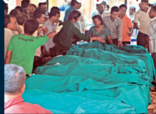
■火災死者眾多，家屬前往認屍。