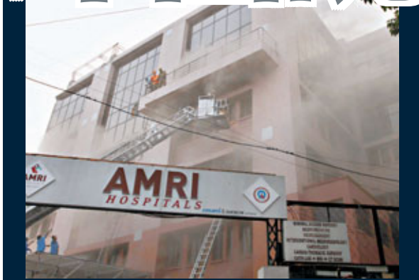
■加爾各答醫院濃煙滾滾。