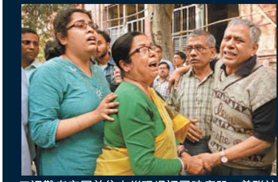
■遇難者家屬前往火災現場認屍時痛哭。

印度加爾各答一家醫院昨晨發生大火，造成最少89人死亡。當地官員稱，死者大部分為院內病人，受火舌所困吸入濃煙窒息致死。當地官員猛烈譴責醫院職員在大火時只顧逃跑，置病人生死不顧。警方以涉嫌謀殺罪拘捕6名醫院主管。