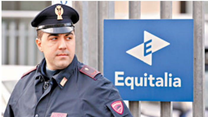
■警方進入Equitalia稅務公司調查。

繼德意志銀行總部周三收到「郵包炸彈」之後，意大利一家國營稅務機構昨亦遭同類襲擊，機構局長被炸傷，失去其中一截手指。一個意大利無政府主義組織前日承認與德意志的郵包炸彈有關，德意警方正追查兩宗案件是否有關。