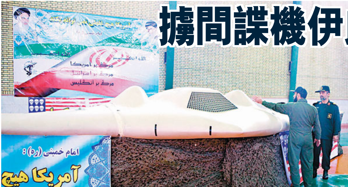
■伊朗革命衛隊高官向外界展示被擊落的美國RQ-170無人偵察機。