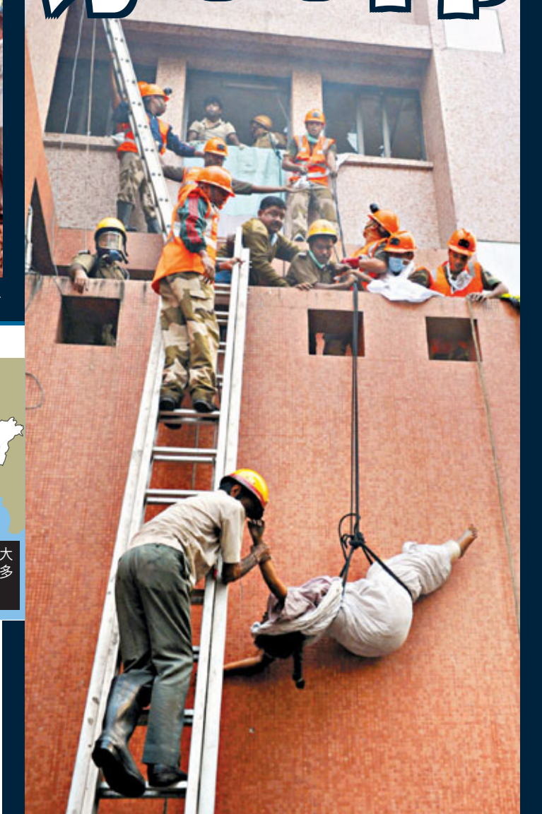
■救援人員由醫院高處救出被困者。

印度加爾各答一家醫院昨晨發生大火，造成最少89人死亡。當地官員稱，死者大部分為院內病人，受火舌所困吸入濃煙窒息致死。當地官員猛烈譴責醫院職員在大火時只顧逃跑，置病人生死不顧。警方以涉嫌謀殺罪拘捕6名醫院主管。