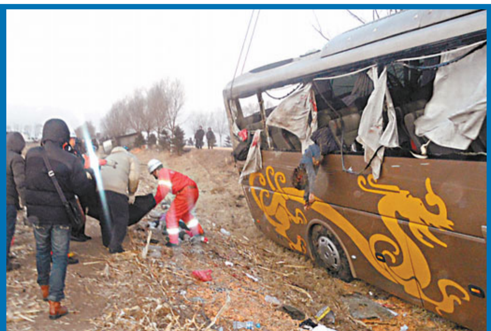
香港永安旅遊團旅遊客車車禍現場。

榆樹市醫院發言人表示，受傷港人情況並不嚴重。入境處發言人表示，港府十分關注事件，已即時透過駐京辦向內地有關當局了解情況，並與永安旅行社取得聯繫，已派員趕赴哈爾濱提供協助，按團員情況及意願，提供可行協助，市民如需協助可致電入境處「協助在外香港居民小組」的求助熱線(852)1868。