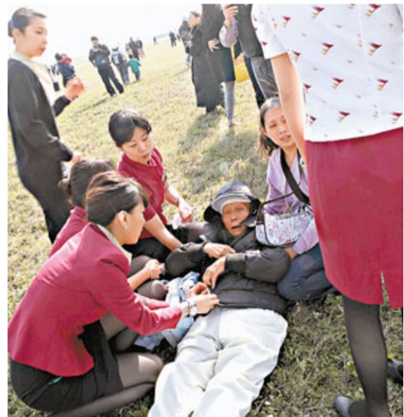
國泰空中服務員，在現場協助護理疏散過程中受傷的乘客。