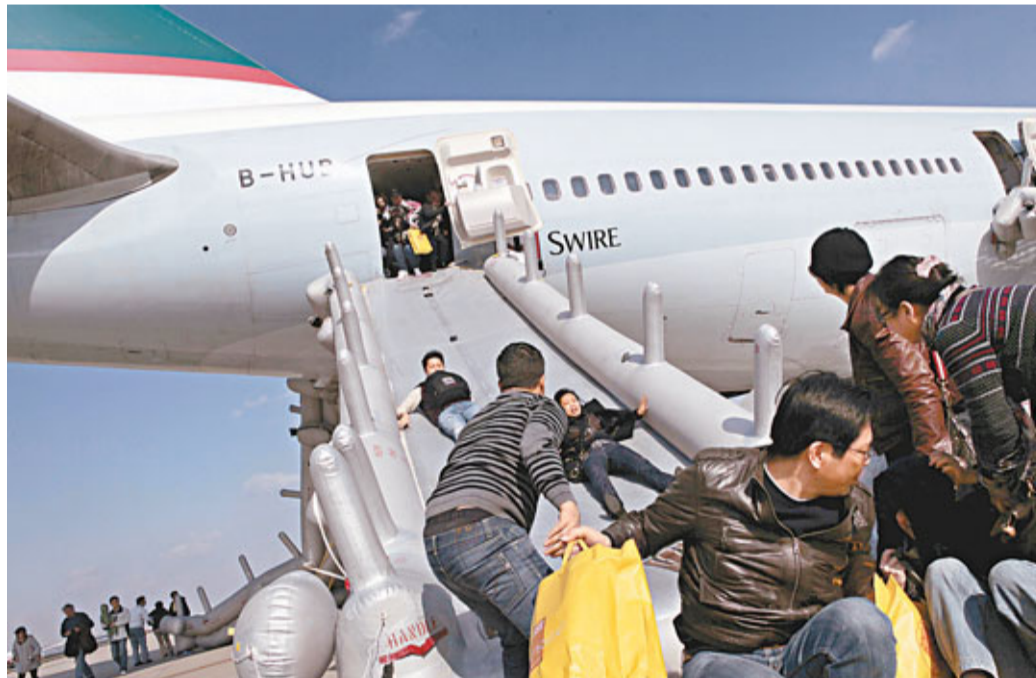
國泰航班CX365昨在上海浦東機場起飛前機艙突然冒煙，乘客緊急疏散。