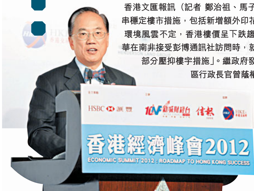
■曾蔭權稱，暫時無意檢討額外印花稅，希望大家不要「捕風捉影」。

曾蔭權昨日出席「香港經濟峰會2012」午餐會並發表演說。就近日市場流傳當局會放寬額外印花稅等穩定樓價措施，曾蔭權主動回應道：「我想重申，特區政府會繼續打擊短期炒賣，而且推行我們其他一籃子措施，維持樓市的健康、穩定。政府會有需要時候檢討這些措施，但現時完全沒有啟動這個機制。同時，我們會繼續以各種途徑去增加土地供應。」