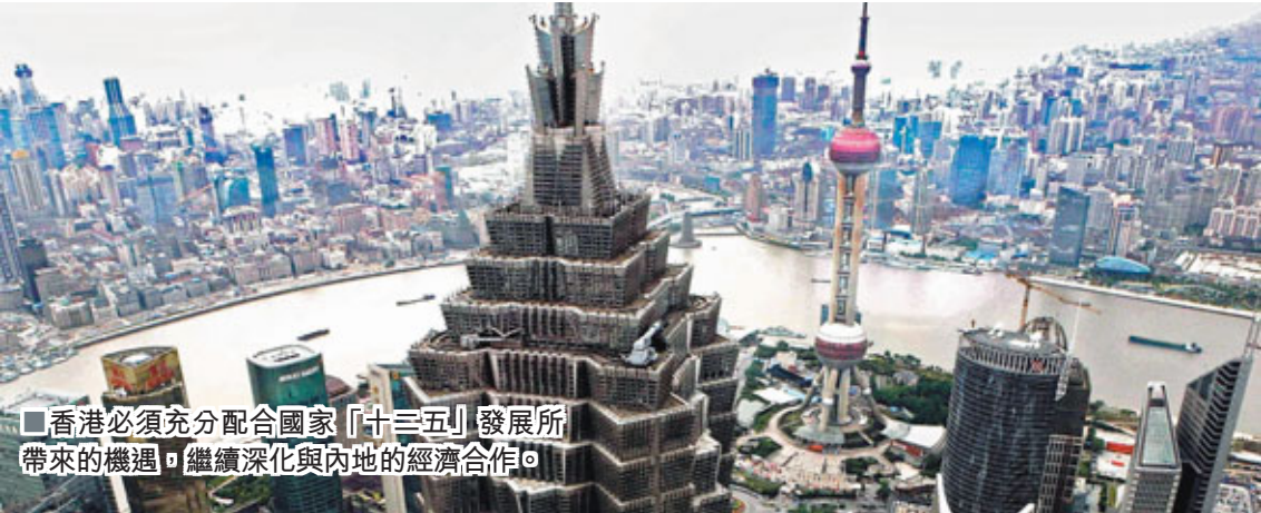
■香港必須充分配合國家「十二五」發展所帶來的機遇，繼續深化與內地的經濟合作。

他並強調，香港在2009年受環球金融經濟衰退衝擊時，香港的金融業較製造業、進出口業，在職位數目和增值方面都恢復得更快、更強勁，「衰得慢，恢復得快」，製造業在衰退時則「衰得快，恢復