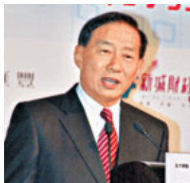
■王冬勝稱，現時樓價下調幅度不多，不用急於放鬆政策。

香港文匯報訊（記者 馬子豪）財政司司長曾俊華前日表示不排除放寬樓市調控措施，匯豐亞太區行政總裁王冬勝表示，現時樓價下調的幅度不多，現階段應不急於放鬆政策，目前仍需時候觀望應否鬆綁。王冬勝昨出席香港經濟峰會時指，雖然目前本港二手樓宇交投有所縮減，但一手成交仍保持暢旺，且樓價下跌幅度亦不嚴重，故認為當局仍可觀望一段時間決定是否需要鬆綁；他又認為政府多番推出收緊樓市措施，不時檢討仍是正常做法。