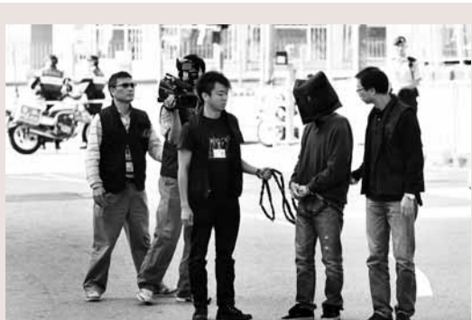
警方昨日把屯門兇殺案疑犯帶返現場重組案情。

其後,李再到入境處訛稱遺失身份證,入境處發出收據作臨時身份證之用。他以電腦掃描,並更改為馬的資料,憑此偽造收據及偽造文件,到星展銀行申請信用卡,結果被銀行職員揭發,同日被警方拘捕。