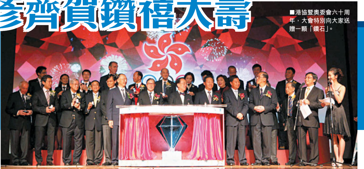
港協暨奧委會六十年,大會特別向大家送贈一顆「鑽石」。

2011年是中國香港體育協會暨奧林匹克委員會(港協暨奧委會)成立六十周年,其慶典慶祝活動——港協暨奧委會六十周年宴會,日前於香港君悅酒店舉行。大會以一顆「鑽石」揭開序幕,緊接展出香港體壇六十年來的歷史圖片和影片,更向逾百位曾參加五個綜合項目運動會香港獎牌運動員頒授紀念獎牌,而以中英文雙語著述的《日新又新》也告出版,以誌慶。