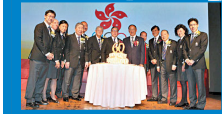
港協暨奧委會義務委員主持切蛋糕儀式,標誌儀式圓滿結束。