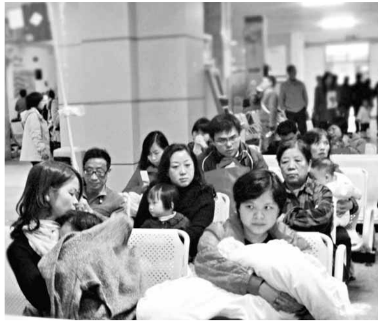
會漲不會降。這位負責人表示,「金牌」月嫂都曾在婦產科做過醫生,持醫師證書。另外,她們還會做台灣知名的「廣和月子餐」。

廈門合佳佳母嬰服務中心提供「金牌」月嫂服務。工作人員說,目前價格是六千元,明年的價格尚未確定,但肯定只