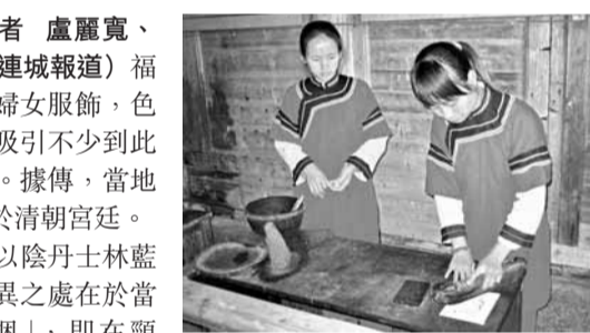
■四堡鄉婦女服裝的袖子,是因當年參與雕版印刷作業,為免衣袖沾上油墨而高挽的。

據說,這是因為當年婦女參與雕版印刷作業,為免衣袖沾上油墨,故而高挽。相傳清朝初年,四堡的一位商人在京城經商,常常看到皇宮貴族婦