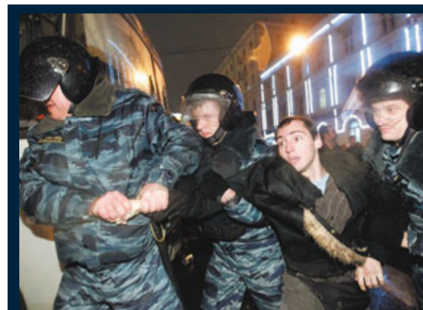
莫斯科軍警拘捕示威者。