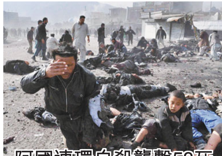
阿國連環自殺襲擊58死

澳洲國家零售協會行政總裁奧斯蒙德歡迎措施，指有助刺激本月零售額。他估計聖誕節期間澳洲民眾花費較去年為多，約250億澳元(約1,984億港元)。澳洲今日公布第2至3季經濟數據，估計第2季增長為1.2%，第3季季升1%至1.3%，通脹率則預料為0.6%。 ■法新社/美聯社/彭博通訊社