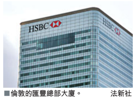
倫敦的匯豐總部大廈。

在全球金融危機的陰霾下，銀行收入大幅下降，但銀行高層繼續坐擁高薪厚祿。英國銀行業現時面臨股東及監管機構左右夾擊，其中投資者已要求匯控等5大行改革高層薪酬架構及花紅金額。代表英國1/6投資者的英國保險業協會(ABI)，前日去信匯控、渣打、蘇格蘭皇家銀行、巴克萊及萊斯銀行，要求對方改革薪酬架構。ABI發言人表示，期望銀行大幅降低花紅及個人獎金，與員工同