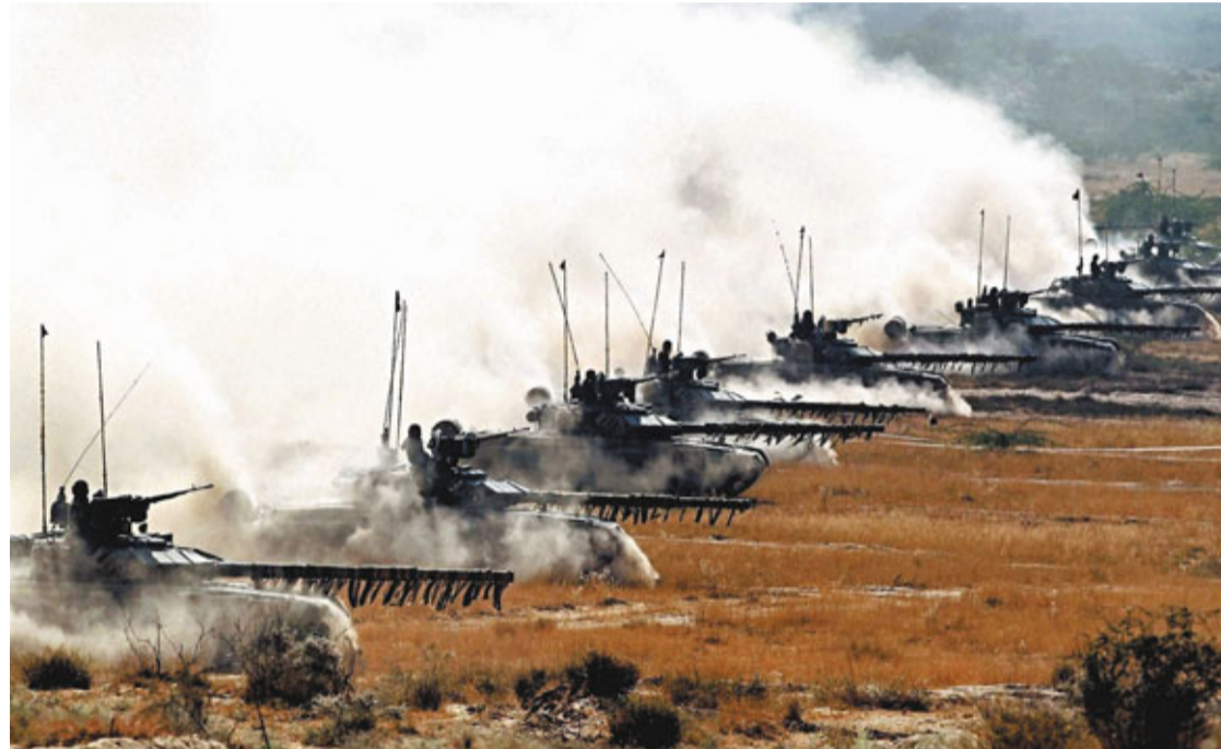
印度近日舉行軍事演習展示武力，圖為T-90坦克部隊在沙漠行進。