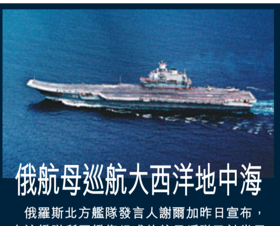
俄航母巡航大西洋地中海

標普警告調低歐元區15國評級，導致俄股昨收市急跌3.9%，是兩周以來最大跌幅，表現為全球最差。 ■路透社/法新社/美聯社/英國《金融時報》