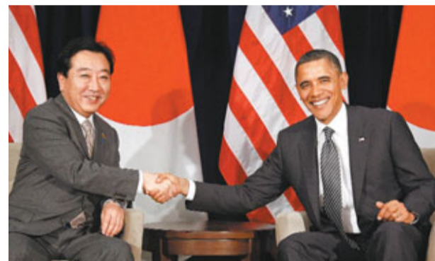
美日印副外長將舉行首次3方會談。圖為日本首相野田佳彥(左)與美國總統奧巴馬上月在上月APEC峰會上握手。

政治分析員指出，美日印3國在多方面有着共同利益，包括經貿及核發展方面，但首次會談的焦點將離不開中國。智囊組織「新美國安全中心」資深顧問方丹表示，中國是3國利益策略推動者，適逢2013年初中國領導層換屆，北京可能憂慮這次會談旨在「圍堵中國」。他認為，雖然各國近期在亞太地區蠢蠢欲動，相信北京方面未必太憂慮，但會視為在中南半島和太平洋地區最新的行為發展模式。美國早前促請中國不應讓南海爭議危及重要航運，美國官員聲稱目的不是威脅中國，中方則警告美方不要再挑起冷戰式敵對狀態。美國現時與日本安全關係密切，正尋求與印度發展類似關係，包括尋求與印度和澳洲簽訂3方防衛協議。 ■路透社/新華社