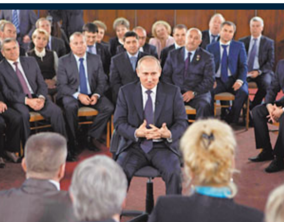
普京對支持者講話。

俄羅斯國家杜馬(下議院)選舉舞弊指控不斷，約6,000名民眾昨晚在首都莫斯科上街抗議，其間示威者與警方發生衝突，逾300人被捕。數以千計警察和內務部部隊昨在莫斯科市中心巡邏，警方拘留前部長、反對派「右翼力量聯盟」領袖涅姆佐夫。總理普京前日在內閣會議上堅稱，選舉結果讓統一俄羅斯黨(統俄黨)有機會更沉着及流暢處理日後工作。反對派矢言繼續示威抗議選舉結果後，內務部已派出部隊進駐莫斯科市中心，並提升其警戒級別，聲稱確保民眾安全。至於得票率近20%的第2大黨俄羅斯共產黨，前日逾400名支持者集會抗議選舉不公。