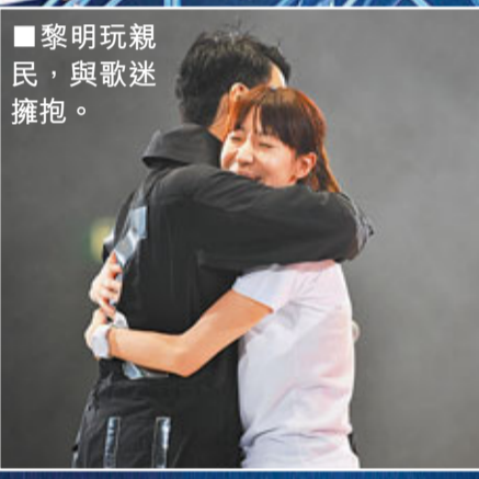
黎明玩親民,與歌迷擁抱。

狀態甚佳的Leon大唱經典歌曲,又在台上勁歌熱舞,表演揮大旗,贏得觀眾不少掌聲,當他唱到《sugar in the marmalade》一曲時,有女舞蹈員突然撕下外衣,露出BraTop和熱褲,現場立時升溫,全場嘩然。雖然遇上味高峰一度無聲,Leon處變不驚繼續落地跳舞,他別樹一格的舞蹈都頗有睇頭。Leon邀請剛加盟的陳小春和旗下歌手JW、李思捷擔任嘉賓,Leon介紹小春出場,指二人十年沒見,但知他喜歡唱歌,現在很開心可以同一間公司,小春上台即識做大叫Leon「老闆」:「多謝老闆,沒有你,我便沒機會站在這兒。」Leon似乎對「老闆」稱號不習慣,笑說:「唔好咁講呀,大佬。」二人合唱《友情歲月》,JW則以「谷胸」露出三吋事業線上陣,令人眼前一亮,而李思捷扮盡三大天王劉德華、張學友和