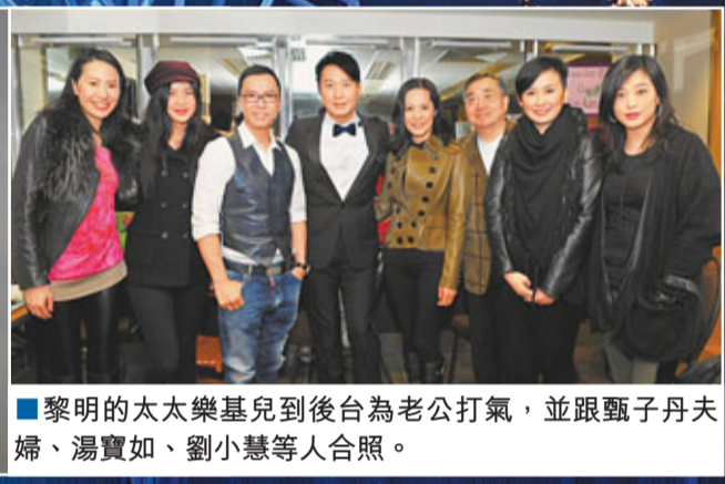
黎明的太太樂基兒到後台為老公打氣,並跟甄子丹夫婦、湯寶如、劉小慧等人合照。