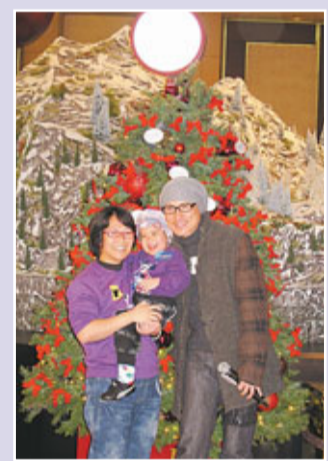
香港文匯報訊 張學友(見圖)前剛在中山完成他第百場「張學友1/2世紀世界巡迴演唱會」,前晚他出席在中環置地廣場舉行的「願望成真基金」。

問到他可有恭喜好朋友劉德華作爸爸?學友表示已透過朋友向華仔道賀。身為兩個女兒的父親表示,華仔與他同年,現在當爸爸很適合,因為當爸爸要做很多運動,例如他要抱起兩個女兒,和她們玩騎馬,跟着她們跑,少點氣力都會喘氣。除了華仔當爸爸外,陳慧琳、楊千嬅都指懷有龍胎。學友稱希望華仔和陳慧琳都平平安安順利,他卻指千嬅如果有孕不應開演唱會,雖然唔着鞋,都唔係幾好。