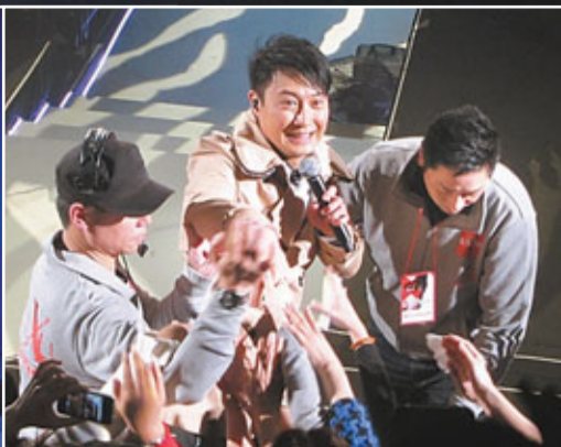
黎明「安哥」時握手握足二十分鐘。