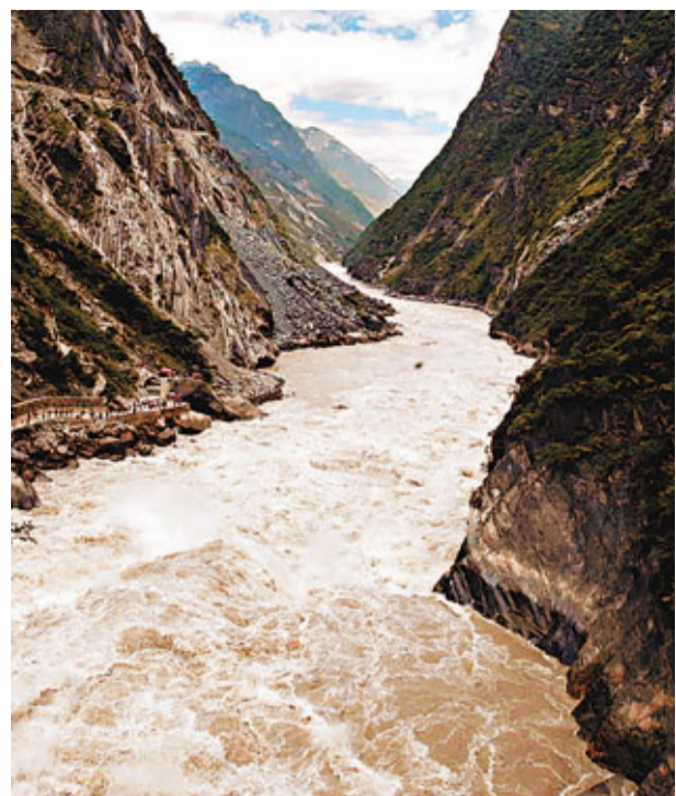
毛主席詩詞《七律·長征》中「金沙水拍雲崖暖」隱含《三國演義》故事情節。圖為山高谷深、灘險水急的金沙江。