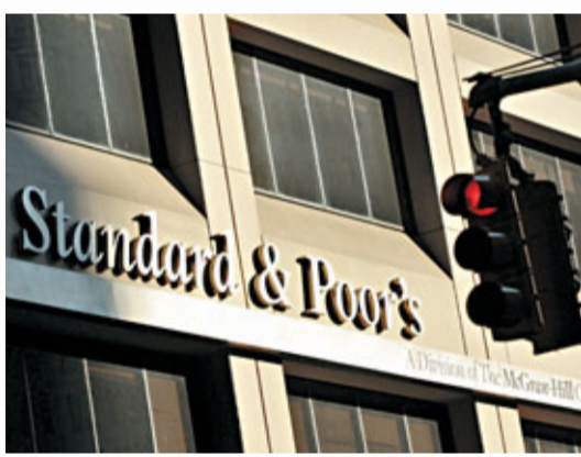
德國、法國、荷蘭、奧地利、芬蘭和盧森堡這6個最高AAA主權信評級國，一併被列入負面觀察，意味在未來90天內，有50%幾率被降級。標普指，德國、荷蘭、奧地利、芬蘭、盧森堡和比利時有可能被降1級，法國等其他國家可能最多降2級，最終決定取決於峰會結果。