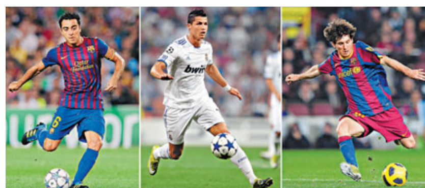
沙維、C朗、美斯(左至右)成金球獎最後3強。