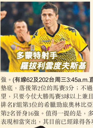
多蒙特射手 羅拔利雲度夫斯基