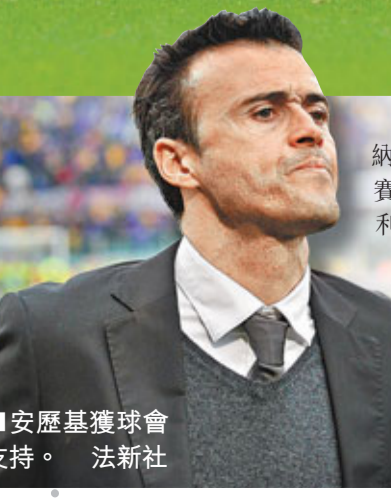
安歷基獲球會支持。

外，「祖記」前鋒迪比亞路在比賽中頭部撞傷，他的左側太陽穴部位血流不止；據意大利當地媒體報導，「祖記」隊醫現場給他縫了8針，然後把他送進醫院接受進一步治療，好得這位意大利著名前鋒沒有腦震盪。