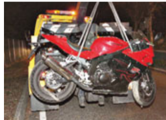
跑車款電單車失事，釀1死1傷的電單車。

香港文匯報訊(記者 杜法祖) 大埔發生奪命車禍。一輛新車落地不久的跑車款電單車，前晚深夜11時許駛經吐露港公路支路失控撞掃欄，鐵騎士與乘客雙雙被拋彈數米外墮地浴血，其中重傷司機送院證實死亡。警方正就車禍原因展開調查。