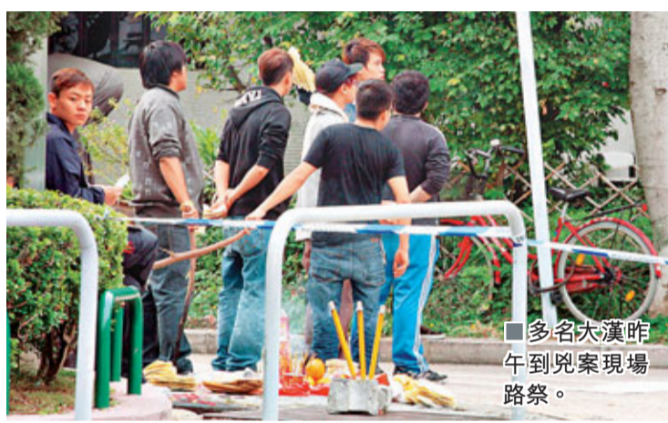
多名大漢昨午到兇案現場路察。

香港文匯報訊(記者 杜法祖) 屯門昨凌晨1個半小時接連發生3宗釀成1死3人受傷斬人血案。其中在良田村，3名蒙面刀手襲擊10多名青年，混亂中一名18歲號「郭靖」青年身中多刀復疑被汽車輾過，送院搶救近5小時證實死亡，警方已將該案列作謀殺案交由新界北總區重案組跟進，初步不排除涉及黑幫內訌。昨晚警方在區內拘捕一名23歲男子，證與案有關。