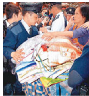
遭票控檔販女助手與食環署人員爭奪擬充公的貨物。

食環署在火警後向花園街檔販表達要嚴格執法，如不符合規格營業會立即檢控。販商要求署方給予2個月寬限期，讓販商邊開業邊改建排檔檔架的高度以符合規定。有檔主會上提出有排檔3日內收到18張告票，根本無法做生意，故要求暫緩執法；又要求給予明確指引，排檔如何改善才合規格，但據悉均未獲署方明確回應。