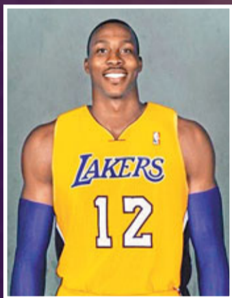
懷特侯活如加盟,將補湖人短處。

在球員工會本月1日重組後,2日就開始了與聯盟進行新協議次要議題的談判,這些議題主要是非經濟方面的條例,如反興奮劑、總裁和球隊懲罰條例、選秀年齡等。雙方的目標是力爭在6日完成全部協議內容的談判,這樣7日球員工會將在紐約召開會員大會時,最終版的勞資協議才能呈現給球員。8日球員工會和球隊老闆將各自對新協議進行表決,雙方只要贊成票過半,那麼新一期勞資協議將正式實施,新賽季訓練營也將於9日正式開營。