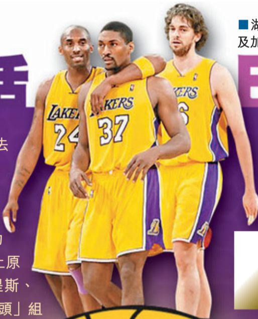
湖人3星高比拜仁、阿堤斯及加索(左至右)。