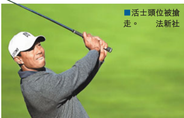
活士頭位被搶走。

另外,4日在美國加州舉行的世界高爾夫球挑戰賽,莊遜3回合後,以1桿領先活士,升上榜首。上回合排第4的莊遜,首十個洞都是平標準桿,但之後表現突出,打出兩次低兩桿的「老鷹」,包括最後第18洞,另外還有兩次「小鳥」,這日以低4桿完成比賽,總成績就以低8桿超越原本領先的活士。活士當天打出4隻「小鳥」都補不回5次超一桿,全日打出超1桿成績,總成績就是低9桿,排第2位。