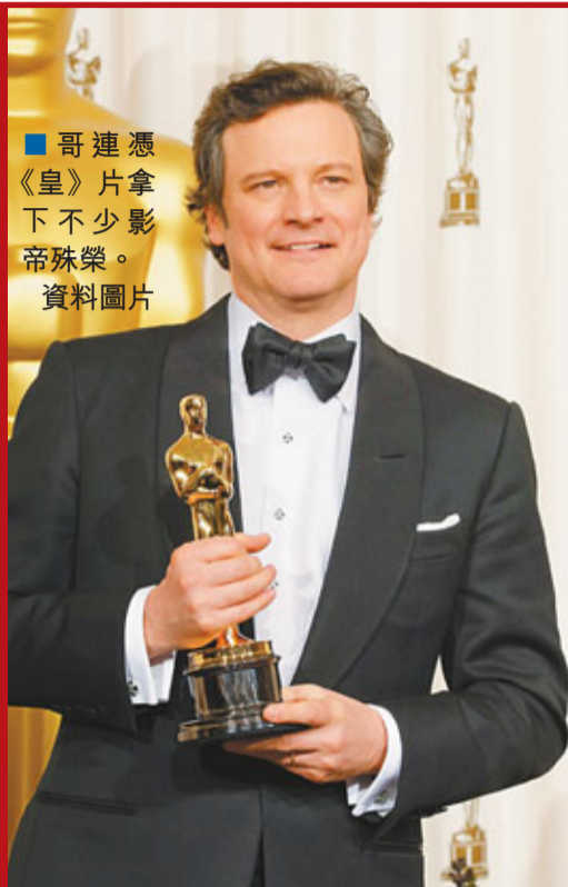
哥連憑《皇》片拿下不少影帝殊榮。