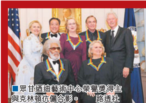
甘迺迪藝術中心榮譽獎得主與克林頓伉儷合影。