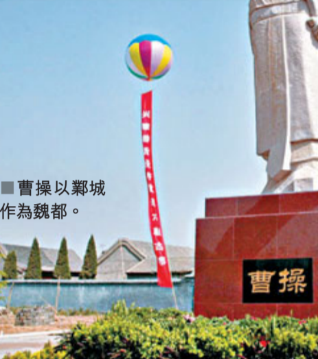
曹操以鄴城作為魏都。