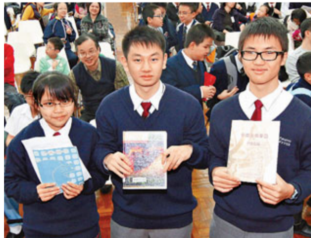
東華三院伍若瑜參賽隊閱讀不少中國歷史文化書,還自製筆記。

3.填充題：《情僧錄》是名著_____的別名。 答案：《紅樓夢》 資料來源：大會提供 製表：香港文匯報記者 歐陽文倩