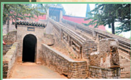
位於金鳳台上的轉軍洞,是曹軍的秘密通道。