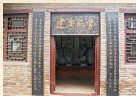
金鳳台專門設立「建安文人」的雕塑和事跡介紹。

三國時期的曹操,廣攬天下人才,不僅使一大批有治國用兵方略的人才投奔帳下,而且還有不少飽學之士,也逐漸從全國各地匯集到曹操的大本營鄴城。隨著曹操統一北方戰爭的向北擴展,鄴城就成了可靠的大後方,形成了較為穩定的社會環境和生活環境,鄴下文人們的文學創作活動也日益興起,逐步形成了一個以「三曹」(曹操、曹丕、曹植)、「七子」(王粲、陳琳、阮瑀、劉楨、徐幹、應瑒、孔融)為代表的頗有影響力的鄴下文人集團——建安文人集團。