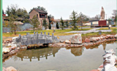
有曹操塑像的鄴城遺址。