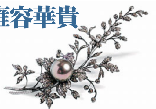
惠記珠寶的美鑽點綴珍珠襟針。

而Paspaley南洋珍珠的Muse by Paspaley系列設計獨特，採用剛強的黑瑪瑙、浪漫的玫瑰晶和文靜的月光石，與自然優雅的珍珠配襯得恰到好處，共同構成充滿浪漫色彩的首飾。Paspaley的聖誕系列還有時尚型格的黑尖晶石項鍊、高貴典雅的粉紅藍寶石戒指及亮麗雅致的南洋珍珠袖口鈕。優雅動人的珍珠吊墜綻放柔光華，亦能完美搭配節日的各款造型。