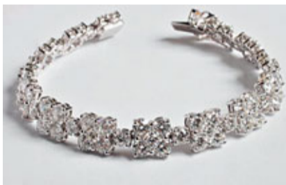
惠記珠寶的鑽石手鐲。

你還可選擇一系列以鑽石襯托不同名貴寶石的款式，如藍寶石戒指或翡翠耳環等，配襯不同顏色的晚裝，兩者互相輝映，相信宴會上的賓客都會向你投以讚美目光。