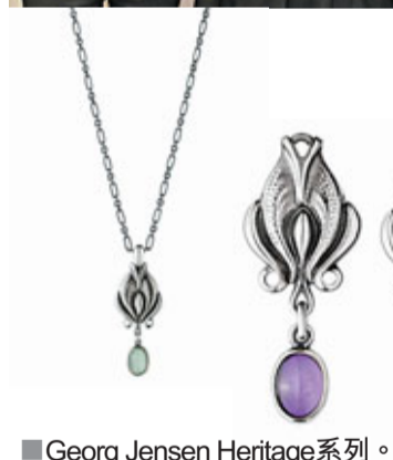
Georg Jensen Heritage系列。