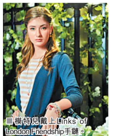
模特兒戴上Links of London Friendship手鐲。