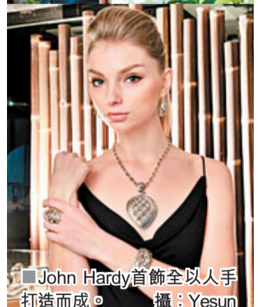
John Hardy首飾全以人手打造而成。