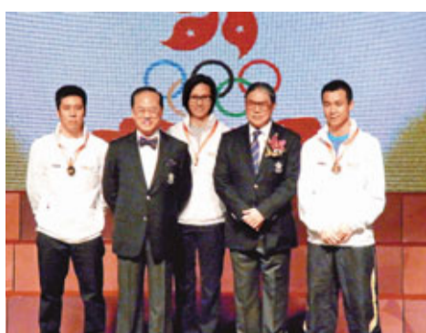
■首曾蔭權(左2)與奧運獎牌選手李麗珊及乒乓球賽合照。

香港文匯報訊 (記者 潘志南) 香港體育協會暨奧林匹克委員會60周年鑽禧紀念，昨午假香港君悅酒店宴會廳舉行名為「港協暨奧委會60周年慶祝宴會」，首曾蔭權、中聯辦主任彭華、中國外交部駐港特派員呂新華、國家體育總局局長兼中國奧林匹克委員會主席劉鵬蒞臨主禮和頒獎。