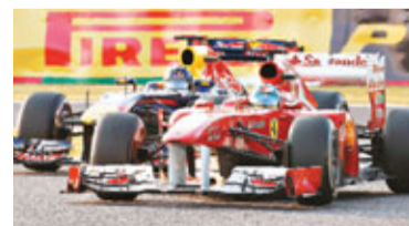
法拉利和紅牛2支F1車隊(見圖)因不滿F1車隊協會在處理減低F1賽車成本等重要議題上，未能取得顯著成效，故雙雙決定退會，不過這2支車隊齊聲表示仍會繼續與其他車隊尋求削減成本的做法。