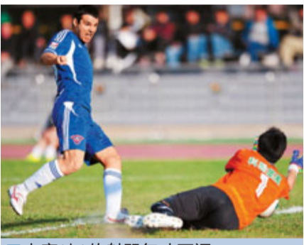
力高(左)的射門無功而還。

至於今日亦有2場聯賽舉行，頭場下午2時30分，深水埗主场迎戰傑志，後者在銀牌失意，但聯賽保持不敗，今場誓不勝不歸，門票一律收20元。另一場賽