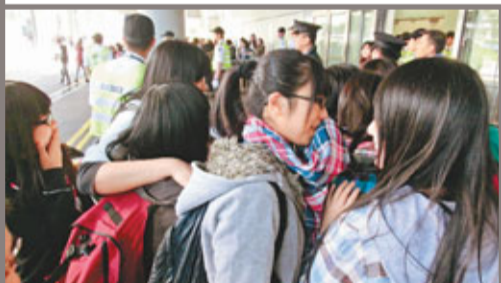
■ Fans見到相葉，開心到攬住朋友哭起來。

他於下午3時飛抵香港，逾500名Fans在開口等候期間，不時唱出嵐的歌曲及高呼其名。因是次有近30位工作人員陪同來港，相葉在禁區擾攘了近1小時才由秘密通道離開。途中他曾停步讓傳媒拍攝，並90度鞠躬及揮手向傳媒打招呼，聽到Fans的呼喊，亦揮手回應，態度親民。