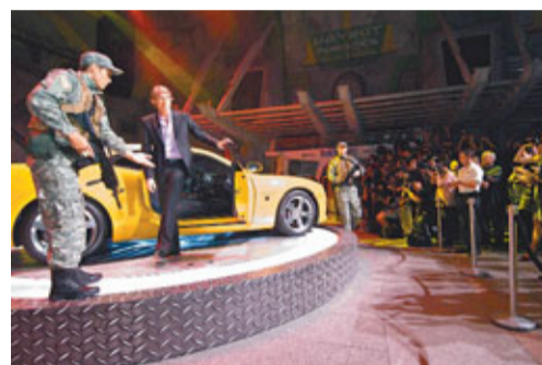
份參與設計。當米高從「大黃蜂」中步出，並以「能量火種」引領揭幕儀式時，隨即引來歡呼。

《變形金剛》的導演米高比爾(Michael Bay)(見圖)於昨晚飛抵新加坡，為環球影城《變形金剛》電影主題過山車——《Transformers: The Ride》舉行揭幕儀式，據知米高亦有份參與設計。當米高從「大黃蜂」中步出，並以「能量火種」引領揭幕儀式時，隨即引來歡呼。另一邊廂，《哈利波特》主題公園繼在美國佛羅里達州的環球影城落成後，有媒體指主題公園也將興建在洛杉磯的環球影城中，更有預測會在2014或15年對外開放。