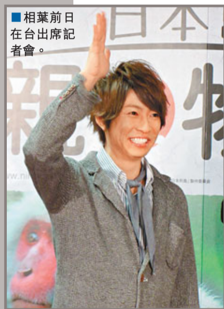
■ 相葉前日在台出席記者會。