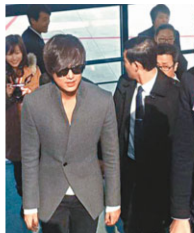
眼見Fans如此熱情，在嚴寒之冬下，他也定會感到非常暖心。 ■ 文：Wyman

韓國男星李敏鎬(見圖)剛在上海與Fans會面後，日前便動身抵達北京，自然又獲大批Fans前往機場接機。早前李敏鎬抵達上海時，因大批Fans為見偶像一面，不斷爭相推撞，令李敏鎬寸步難行，甚至被逼入牆角、推撞倒地，場面極為混亂。前車可鑑，北京Fans接機時顯得井然有序，亦有貼心的Fans自發組成人牆，護送偶像。相信穿上西裝外套，戴上「黑超」步出機場的李敏鎬，眼見Fans如此熱情，在嚴寒之冬下，他也定會感到非常暖心。