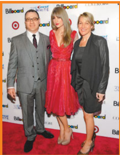
■ Taylor Swift亦獲《Billboard》高層到場祝賀。

早前鄉謠小天后Taylor Swift獲音樂雜誌《Billboard》封為「年度女性」，令Taylor成為史上最年輕而獲此殊榮的歌手。美國時間12月2日，第6屆「Billboard Women In Music」於紐約舉行，一眾獲殊榮者均有現身，心情興奮的Taylor更以新形象示人，別具魅力。談到早前公佈的格林美入圍名單，Taylor於樂壇成績斐然卻只得3項提名，小妮子坦言沒感不快，還為此而興奮哩！