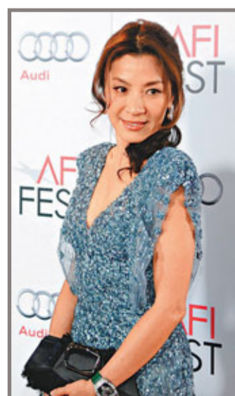
等，而華女星楊紫瓊(見圖)也憑《The Lady》入圍，從而展開龍爭虎鬥。 ■ 文：Wyman

美國金衛星獎(Satellite Awards)昨日公佈提名名單，佐治古尼的新作《繼承大丈夫》(The Descendants)、畢彼特主演的電影《Moneyball》、《The Artist》及《雨果的巴黎奇幻歷險》等將爭奪最佳電影。早前分別在紐約影評人協會及美國國家評論協會獎稱帝的畢佬及佐治，自然在爭帝之列，與之較量的則有里安納度狄卡比奧(J. Edgar)、威尼斯影帝米高法斯賓達(《Shame》)及賴恩高斯寧(《極速罪駕》)等。影后寶座同樣競爭激烈，除了有火熱梅麗史翠普(《鐵娘子》)外，尚有米雪威廉絲(《情迷露露7天》)等，而華女星楊紫瓊(見圖)也憑《The Lady》入圍，從而展開龍爭虎鬥。