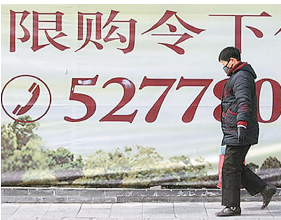
住建部官員認為，「停限」需要外部環境的支持，所以限購在可以預見的未來，不存在放鬆的可能。

此外，有住建部官員向媒體表示，此輪房地產調控最為核心的措施就是以限制性購買為特徵的措施，「停限」需要外部環