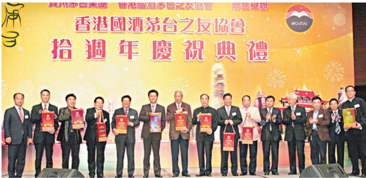
香港茅台之友協會舉辦10周年晚會，賓主合照。

香港文匯報訊（記者 解玲、沈清麗）成立10周年的香港國酒茅台之友協會（簡稱茅台之友會），昨晚假會展廳隆重舉行周年慶祝晚宴，以酒會友。大會邀得該會多位榮譽顧問包括：外交部駐港特派員呂新華，中聯辦副主任李剛、周俊明，以及中國人民解放軍駐港部隊副政委饒新建少將等蒞臨主禮，與全國政協文史和學習委員會副主任、該會會長計佑銘，全國政協文史和學習委員會副主任、該會總監施子清，全國政協常委、該會會長楊孫西等，共賀該會周年誌慶。社會各界友好、多國駐港領事及該會會員逾500人濟濟一堂，把酒言歡，共話國酒文化及弘揚國粹。