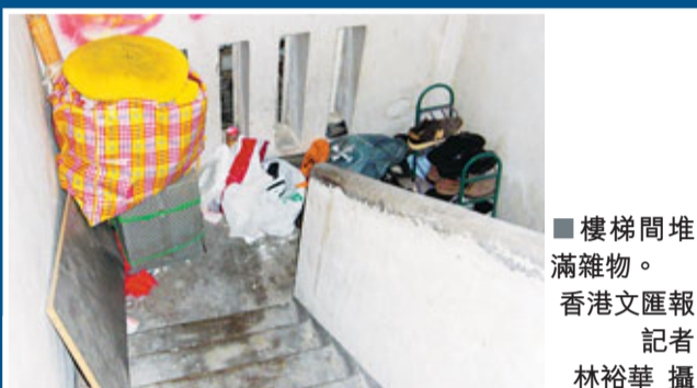
■樓梯間堆滿雜物。