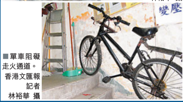
■單車阻礙走火通道。