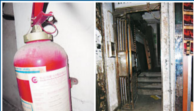
■滅火筒有效期註明為2004年，多年沒有更換。■鴨寮街174號大門照明系統失靈，入夜後變得昏暗。