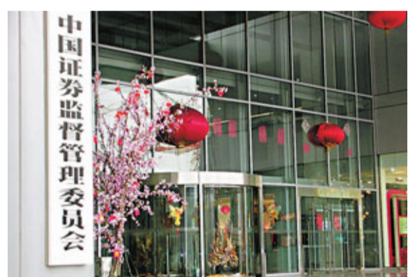
中證監對內地券券IPO並上市的審慎性監管要求予以細化。

香港文匯報訊 中國證監會機構部近日下發通知，對內地券券首次公開發行(IPO)並上市的審慎性監管要求予以細化，並對優質券券有一定程度的放寬。據《中國證券報》周五報道引述相關通知指出，對於市場競爭力達到一定標準的券券，可不要求其具有良好的成