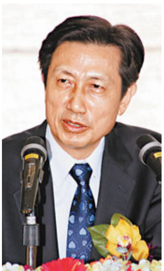
湖北省副省長、宣傳部長尹漢寧。