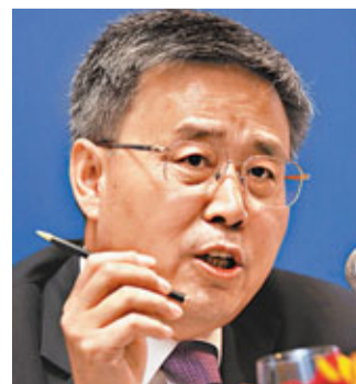
郭樹清列出「十二五」規劃內地資本市場落實五大重點。

香港文匯報訊（記者 李昌鴻 深圳報導）新任中國證監會主席郭樹清最近在深圳第九屆中小企業融資論壇上首次發表其「十二五」規劃的「施政綱領」，他稱這五大重點是拓展和完備儲蓄轉化為投資的機制，切實加快結構調整和產業升級，全力促進科技創新，動員出更多資源來建設文化強國，維護國家經濟金融安全。