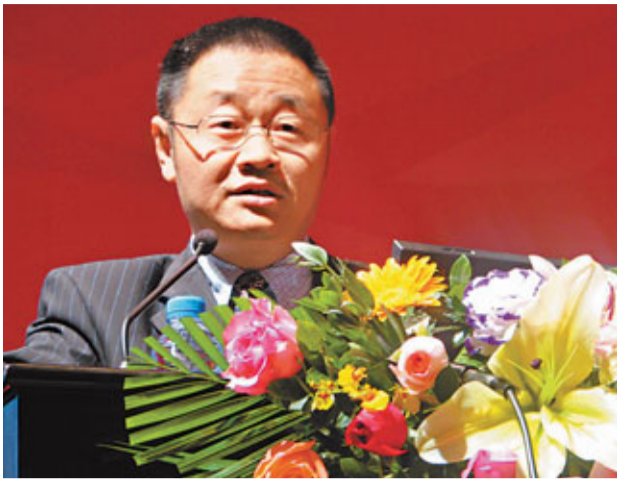
張育軍表示，新股發行價過高暴露出證券市場運行機制仍需完善。

香港文匯報訊 A股IPO發行定價過高一直備受市場詬病，上海證券交易所總經理張育軍指出，指望中證監放緩新股發行節奏是不可能、不切實際的幻想，但應反思為何這麼高的發行市盈率下，機構投資者仍可以接受。