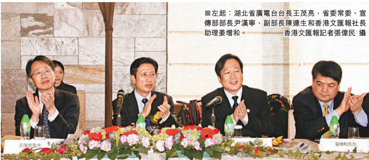
左起：湖北省副省長、宣傳部長尹漢寧，副省長陳連生和香港文匯報社長助理姜增和。

香港文匯報訊（記者 涂若奔）湖北省政府昨日在本港舉辦了「2011年湖北省文化產業項目招商座談會」，會上簽約了4個項目，總投資約230億元（人民幣，下同）。該省省委常委、宣傳部長尹漢寧表示，中央政府和當地政府都非常重視文化建設，港企到當地投資文化產業「正當其時」，希望鄂港兩地加強合作，借助香港平台發揮優勢，共同推動中華文化「走出去」。