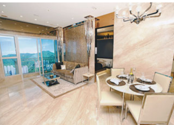
客飯廳面積約200平方呎，視野一直延伸至露台，空間寬敞實用。閃金色貝母片鋪砌之牆身，再加上設計新穎的垂吊式水晶燈，處處散發華麗貴氣。