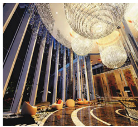
地標式水晶大堂樓底逾50呎高，「幻彩Swarovski閃亮水晶球」吊燈更以逾35,000顆水晶組成，盡顯豪宅氣度。

逾50呎高地標式水晶大堂Empire State Piazza，以逾100噸雲石精細打造，「幻彩Swarovski閃亮水晶球」吊燈更以逾35,000顆水晶組成，炫光璀璨。